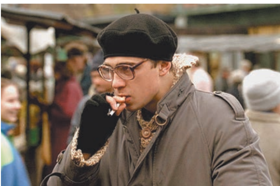
Кадр из фильма «Брат».

Присмотритесь к темам: они не только загоняют художника в рамки определенного периода в истории России, но