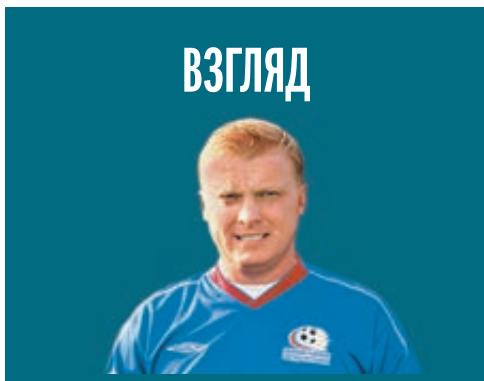
СЕРГЕЙ КИРЬЯКОВ ЭКС-ИГРОК СБОРНОЙ РОССИИ