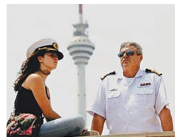
Кадр из фильма «Он был великаном с карими глазами»

Не так много вокруг нас осталось родного, чтобы мы могли им пренебречь. Чтобы мы оставили без этого родного своих детей. Перечитайте Белова, окунитесь в его рассказы, поклонитесь – хоть бы и мысленно – русской деревне. Помяните старика.