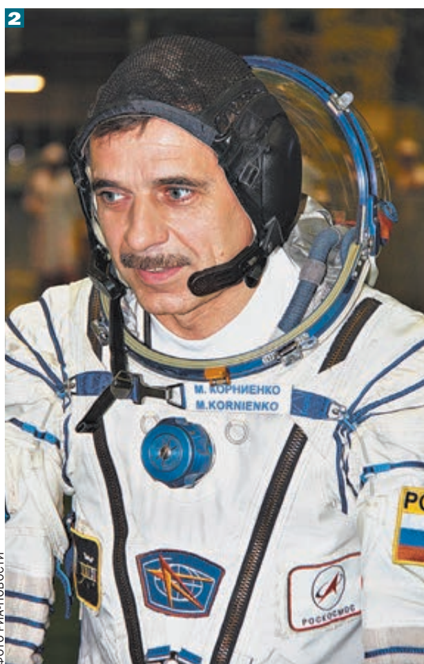
Михаил Корниенко (на фото 2) и Скотт Келли (1) проведут на орбите целый год.