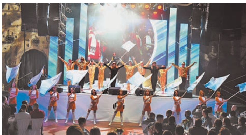
Спартакиада «Роснефти» завершилась красочным представлением для гостей и участников состязаний.

В этом году местом проведения зимних соревнований неслучайно была выбрана Уфа. В спартакиаде «Роснефти» впервые участвовали представители нового актива компании – АНК «Башнефть». К тому же в столице Башкирии традиционно дружат с зимними видами спорта и имеют опыт организации спортивных мероприятий на высоком уровне. Именно здесь каждую зиму проводятся всероссийские соревнования по биатлону, победители которых