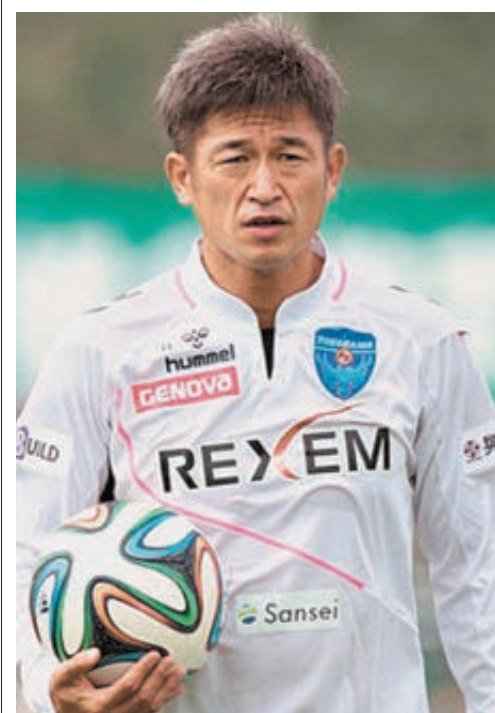
50-летний Миура вписал свое имя в историю футбола.

В 15 лет Кадзуэси в одиночку уехал в далекую Бразилию. Жил в фавеле без электричества. Зарабатывал тем, что возил японских туристов по местным достопримечательностям. А все остальное время тренировался. Настоячиво пробивался не абы куда, а в «Сантос», где провел большую часть карьеры Пеле! И спустя три года это ему удалось. Еще три года