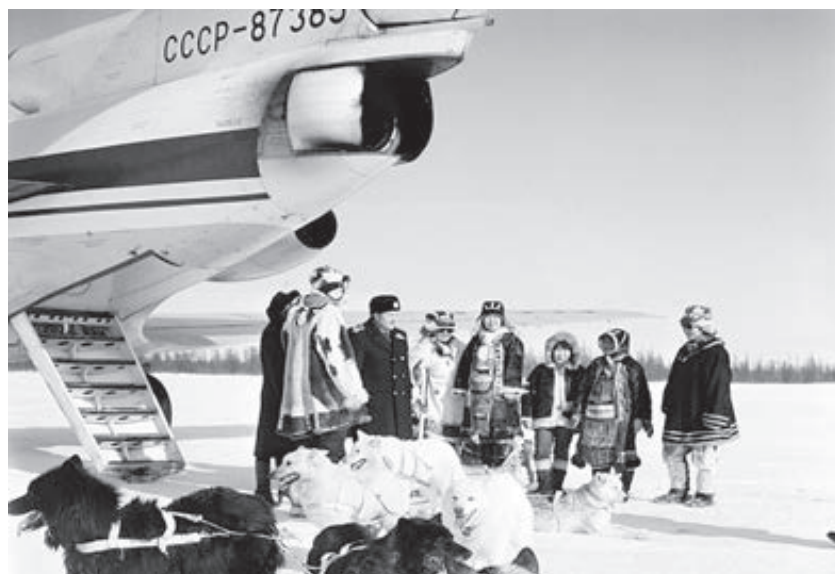
Як-40 в заполярном поселке: такого сегодня уже не увидишь.