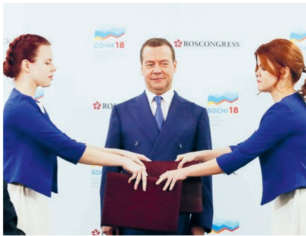
Глава правительства награждает «передовиков каптруда».

Теперь о социальной сфере. В России не ведется, а в лучшем случае только обозначается борьба с бедностью. После принятия решения о повышении минимальной зарплаты до уровня прожиточного минимума выяснилось, что зарплату нужно поднимать в основном в бюджетных отраслях. То есть генератором