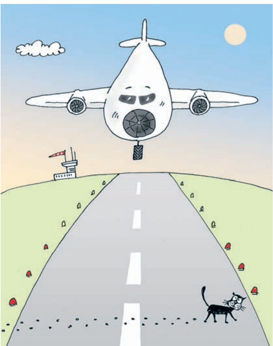
ИЛЛЮСТРАЦИЯ ВАЛЕРИЯ ТАРАСЕНКО/CARTOONBANK.RU

– В 1991 году на территории России было 1450 воздушных гаваней, – утверждает гендиректор Ассоциации