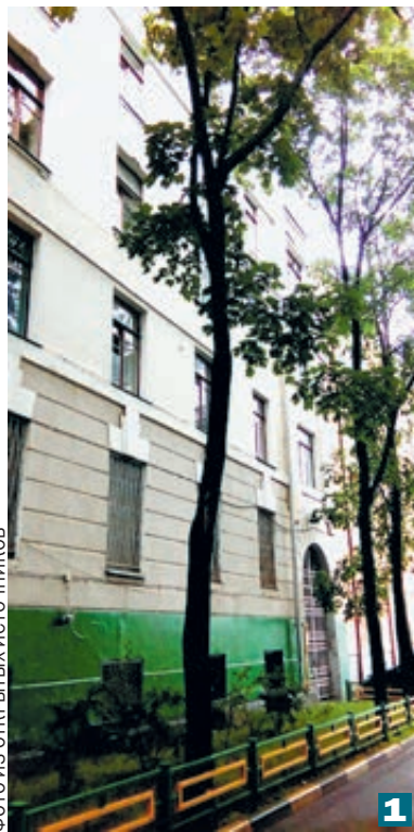
Эти дома на Плющихе 1, Михалковской 2 и Изумрудной 3 улицах удалось спасти.

Уже после обсуждения программы сноса пятиэтажек с президентом страны правительство