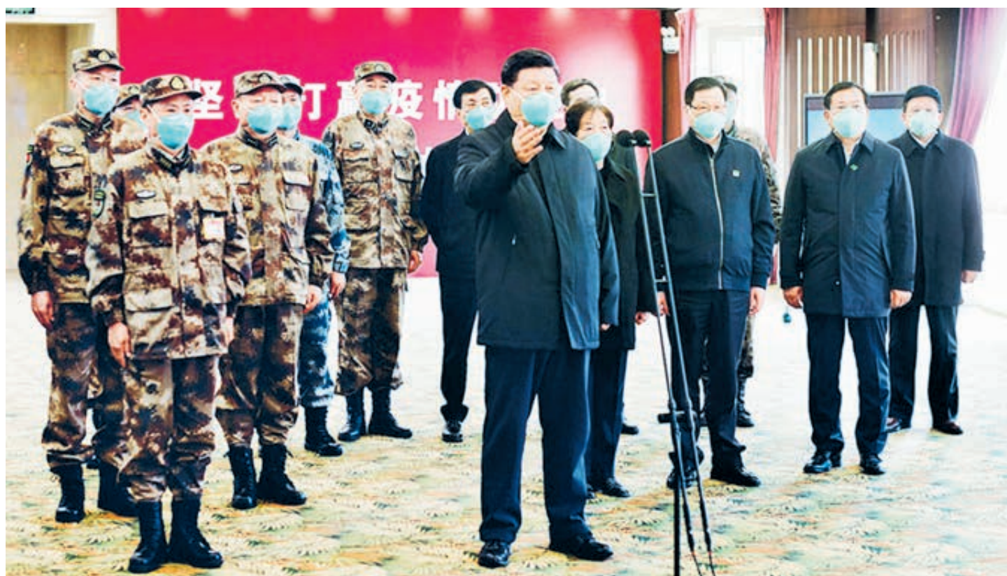
10 марта 2020 года. Генеральный секретарь ЦК КПК, Председатель КНР, Председатель Центрального военного совета Си Цзиньпин специально отправился в город Ухань провинции Хубэй для инспекции работ по профилактике и контролю эпидемии COVID-19. На снимке: Си Цзиньпин в командном центре госпиталя «Гора бога Огня» по видеосвязи беседует с пациентами инфекционного отделения и медицинским персоналом.

Если обратиться к истории человечества, можно заметить, что самое мощное оружие против болезней – это наука и техника. Победа человечества в борьбе против больших бедствий и серьезных болезней была бы невозможна без научного прогресса и технологических инноваций. Исторически сложилось, что в Китае существует много книг по профилактике эпидемий и лечению различных болезней. В «Ханьшу» (исторической хронике династии Хань) написано: «Если настиг мор, необходимо освободить дворцовые палаты, и это будет лучшим лекарством». Становится ясно, что карантин – это важное противозидемическое средство. В эпоху династии Мин появилась вакцинация от оспы. В конце XVIII столетия английский ученый Эдвард Дженнер предложил проводить вакцинацию от черной оспы; благодаря усилиям нескольких поколений ученых прививка от оспы наконец была разработана. По мере развития науки и техники и непрерывного совершенствования общественного здравоохранения инфекционные болезни, такие как холера, чума и грипп, которые ранее создавали для человечества большую угрозу, постепенно