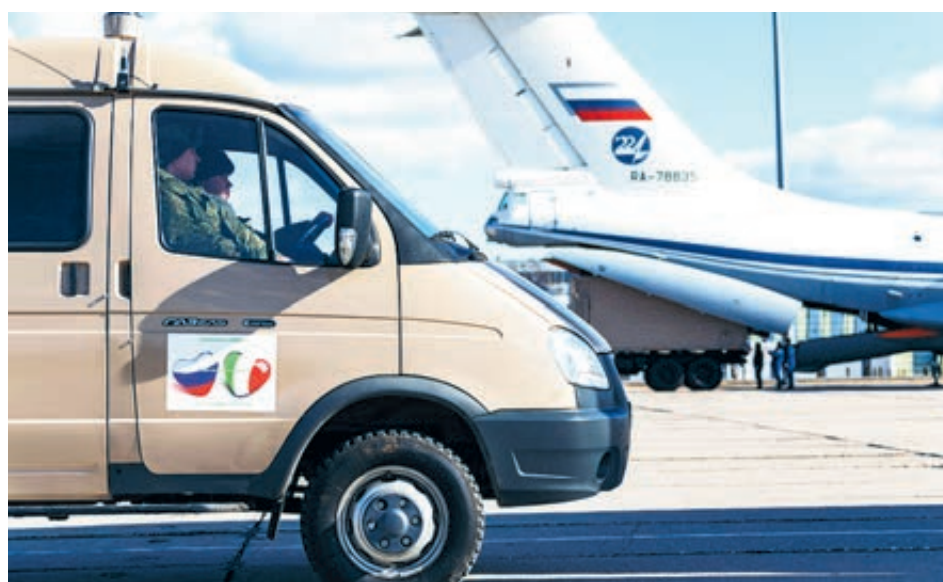
Итальянцы встречают помощь из России со слезами на глазах.

В начале этой недели из Подмосквья в Италию вылетел 14-й по счету военный самолет с вирусологами, военврачами и медтехникой на борту. В роликах, опубликованных на сайте Минобороны, видно, что на каждом из контейнеров на русском, английском и итальянском языках написано: «Из России с любовью». Эмоциональные итальянцы со слезами благодарят через соцсети русских и говорят, что коронавирус заставил весь мир вспомнить о таких подзабытых понятиях, как благородство, взаимовыручка, человечность, и напомнил о существовании жадности, непорядочности и трусости. И международные новости наглядно это демонстрируют.