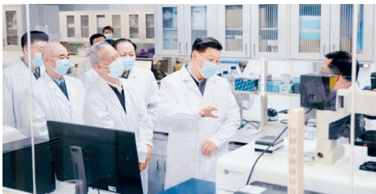
Председатель Си Цзиньпин в лаборатории по созданию лекарственных препаратов для экстренной профилактики и контроля эпидемии Военно-медицинской академии в Пекине.

были взяты под контроль. За последние годы в борьбе с такими заболеваниями, как SARS, MERS, грипп H1N1 и вирус Эбола, наука и техника всегда играли важную роль. С момента образования Нового Китая наша страна, проводя важные специальные исследования и разработки, достигла очевидного прогресса в таких аспектах, как научно-исследовательские разработки профилактики и лечения инфекционных заболеваний, медицинское оборудование, строительство и высококвалифицированные рабочие кадры.