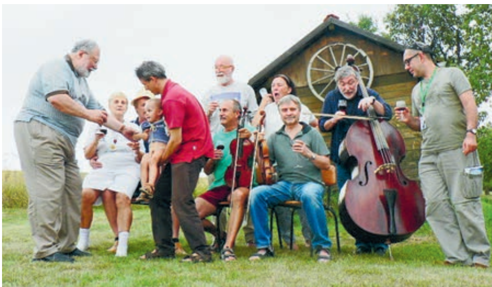
Рустам Ибрагимбеков любит жизнь в самых лучших ее проявлениях.

случился вынужденный простой в кино почти в пять лет. И я стал писать пьесы, которые пошли в театре.