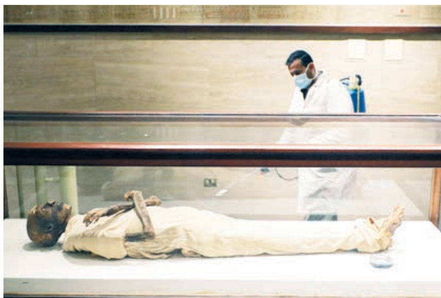
Египетский музей в Каире. С дезинфекцией добрались и до мумий.

Знаменитости, как выяснилось, болеют и заражаются так же, как и простой люд. Вирусу все равно: он косит homo sapiens независимо от вероисповедания, счета в банке, числа кликов в «Твиттере» и аристократичности манер. Слава богу, вышел выздоровевшим Том Хэнкс. Похоже, болезнь у английского принца Чарльза, князя Монако Альбера и актера Идриса Эльбы протекает пока бессимптомно. В худшем положении ослабевший сиделец Харви Вайнштейн и великий тенор Пласидо Доминго, которые находятся в зоне риска. Про инфицированных