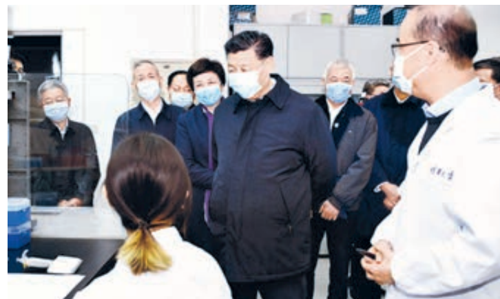
Председатель Си Цзиньпин беседует с научным персоналом Исследовательского центра всемирного здоровья и инфекционных болезней медицинского института Университета Цинхуа.

1) Укрепить взаимосвязь исследований и разработок в сфере лекарств, лечения, медицинского оборудования и помощи больным, находящимся в стационаре, эффективно улучшить скорость лечения и снизить смертность. На 1 марта по всей стране все еще насчитывалось более 7,3 тысячи пациентов в тяжелом и критическом состоянии, число смертей в день по-прежнему остается высоким, в основном это провинция Хубэй и город Ухань. Нужно сделать все возможное, чтобы спасти больше жизней пациентов, что является приоритетом. Основными направлениями здесь являются научно-исследовательская работа по оказанию помощи пациентам в критическом состоянии, укрепление поддержки научных исследований и услуг на передовой по борьбе с эпидемией. Необходимо обеспечить соединение клинических исследований и помощи больным, находящимся в стационаре, чтобы научные достижения применялись при лечении пациентов в эпицентре эпидемии. Нужно ускорить процесс разработки лекарств, сочетая методы китайской традиционной