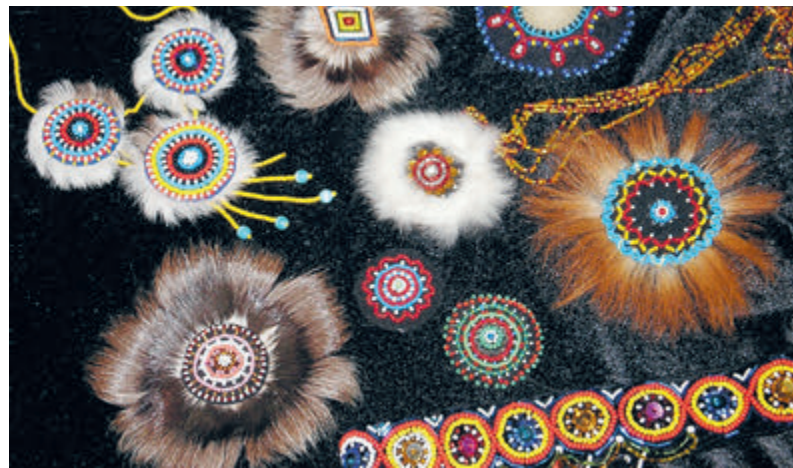
Изделия народных промыслов.

«Уникальные проекты «РН-Шельф-Арктика» с 2017 года проводит не имеющий аналогов в регионе форум «Экоарктика», цель которого – открытый диалог ученых, представителей власти, крупнейших недропользователей и населения по вопросам защиты окружающей среды и сохранения национальной идентичности коренных народов Севера. В мероприятиях форума приняли участие более 2 тысяч человек, около 400 школьников по программе профессиональной ориентации посетили специальные лекции по экологии и геологии.