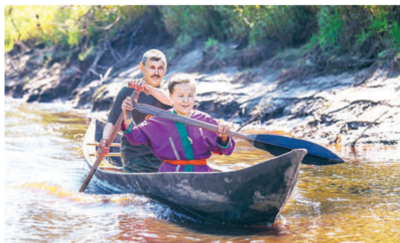
Сплав по быстрой реке.

«РН-Уватнефтегаз» регулярно проводит на Усть-Тегусском месторождении ярмарку товаров традиционных промыслов хантов. Инициатива нефтяников стала ежегодной традицией, которая позволяет жителям района реализовать среди вахтовиков традиционные товары промыслов, изделия декоративно-прикладного творчества, национальную одежду, изделия из пушнины и другие товары. В рамках ярмарки проходят совещания по обсуждению важнейших вопросов жизни и производственной деятельности коренного населения.