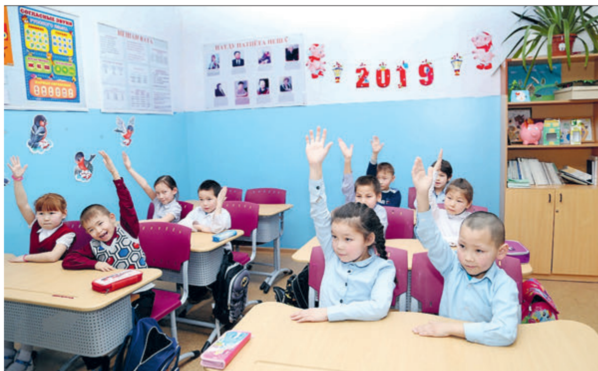
Урок национального языка в школе Харампура.

Благодаря модернизации оборудования на терминале НК «Роснефть» в Архангельске отгрузка нефтепродуктов для северного завода достигнет 110 тысяч тонн. Этот объем превышает в два раза показатели прошлого года