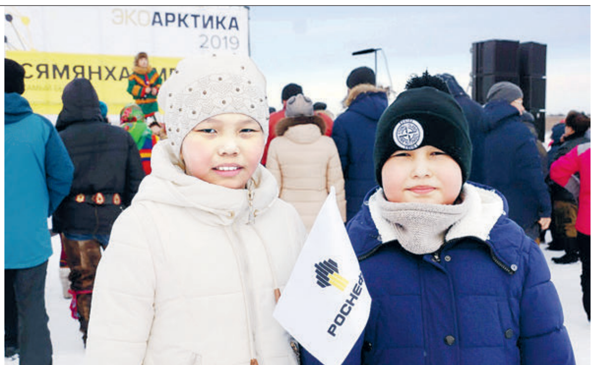
Жители Севера с юных лет учатся беречь природу.