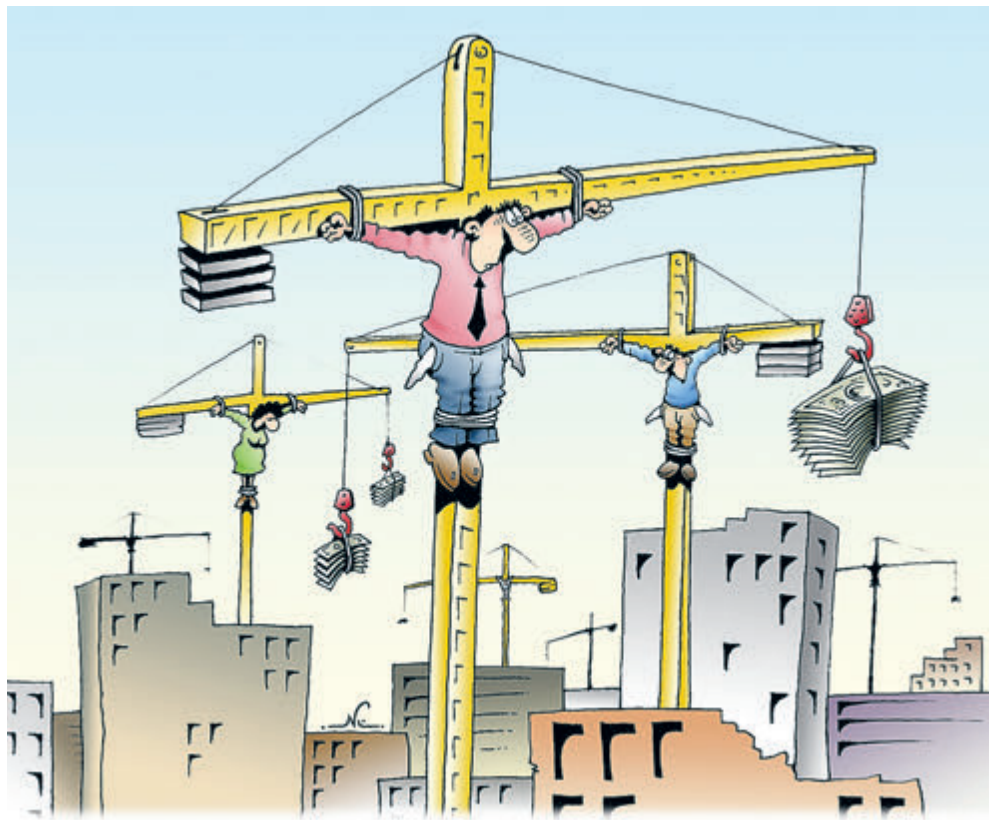
ИЛЛЮСТРАЦИЯ ИГОРЬ КИРИКО / CARTOONBANK.RU

Список можно продолжать долго, ибо легко по пальцам пересчитать регионы и города, где нет жуликов-застройщиков и обманутых ими покупателей. Через три года с этой лавочкой обещано покончить – соорудить квартиры в долг на деньги будущих хозяев будет абсолютно запрещено. К этому же сроку региональным и местным властям велено рассчитаться с беделами, вложившимися в собственный жилстрой, но получившими кукиш. В стране этой проблемой занимается Фонд защиты прав дольщиков и «ДОМ.РФ» – финансовый институт развития жилищной сферы, созданный правительством