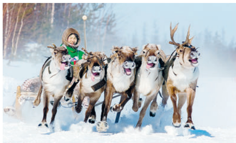
Гонки на оленьих упряжках.

Многие малочисленные народы проживают на труднодоступных территориях и ведут кочевой образ жизни. Их представителям помогают приобрести необходимое оборудование и технику для обе-