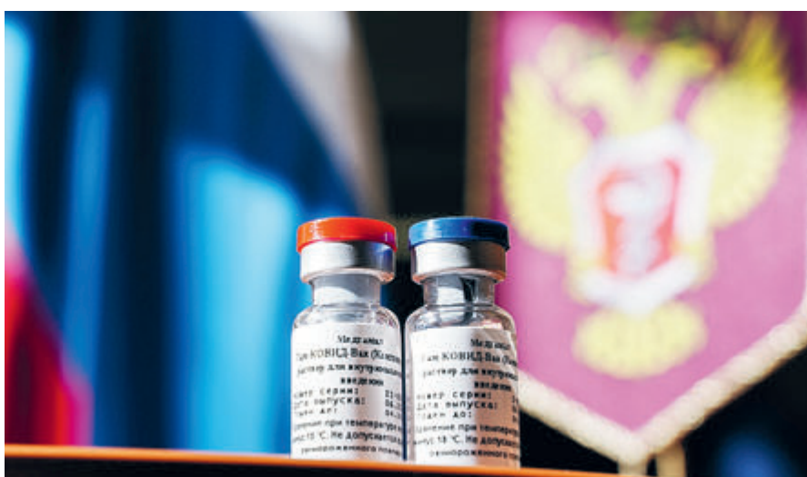
Россия первой в мире зарегистрировала вакцину. Некоторые сравнили эту новость с сообщением о полете Гагарина.

Российская чудо-прививка, названная Gam-COVID-Vac Луо, была разработана Институтом имени Гамалеи. Речь идет о классе векторной вакцины, база которой до того успешно использовалась от аденовирусов, например гриппа. Массовый выпуск новой вакцины начнется в ближайшее время, заявил президент Владимир Путин. Помимо престижа и высокого гуманитарного смысла есть еще и коммерческий аспект. Первенство дает доступ на безграничный рынок большинства стран Африки, Азии и Латинской Америки, которые ждут не дождутся средства, чтобы остановить смертоубийственную заразу.