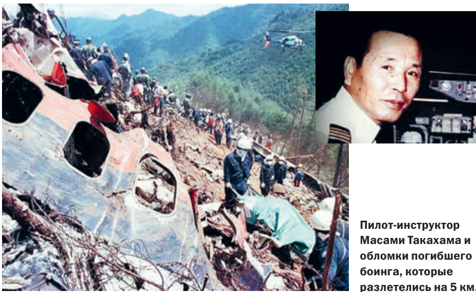
Пилот-инструктор Масами Такахама и обломки погибшего боинга, которые разлетелись на 5 км.

Но за штурвалом оказался опытный пилот-инструктор 49-летний Масами Такахама, который удерживал практически неуправляемую машину в воздухе. Связь с экипажем оборвалась, только когда они попали в зону грозы. После столкновения с землей обломки самолета разлетелись на пять километров. Казалось, выживших в катастрофе быть