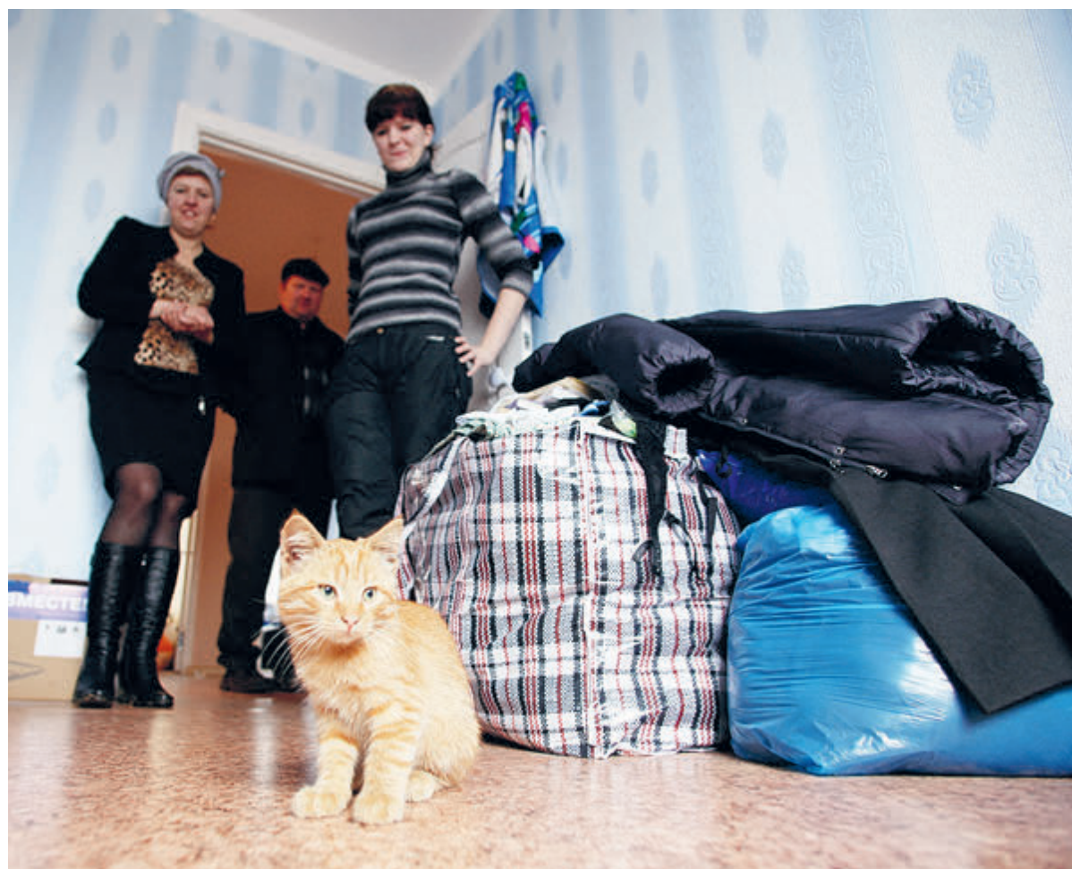
Не всем так повезло: заплатил – и живи на здоровье.

«Мы отметили этот факт и отправили документы в прокуратуру», – сообщила Светлана Орлова. И в июле Генпрокуратура сообщила прессе о начале проверки финансового института развития жилищной сферы «ДОМ.РФ» по признакам коррупции – с