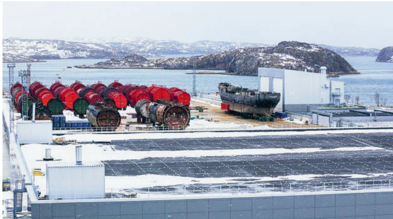
Хранилище отработанных реакторных отсеков в губе Сайда, Баренцево море.

Ну и, наконец, в северных морях покоятся затонувшие суда, в том