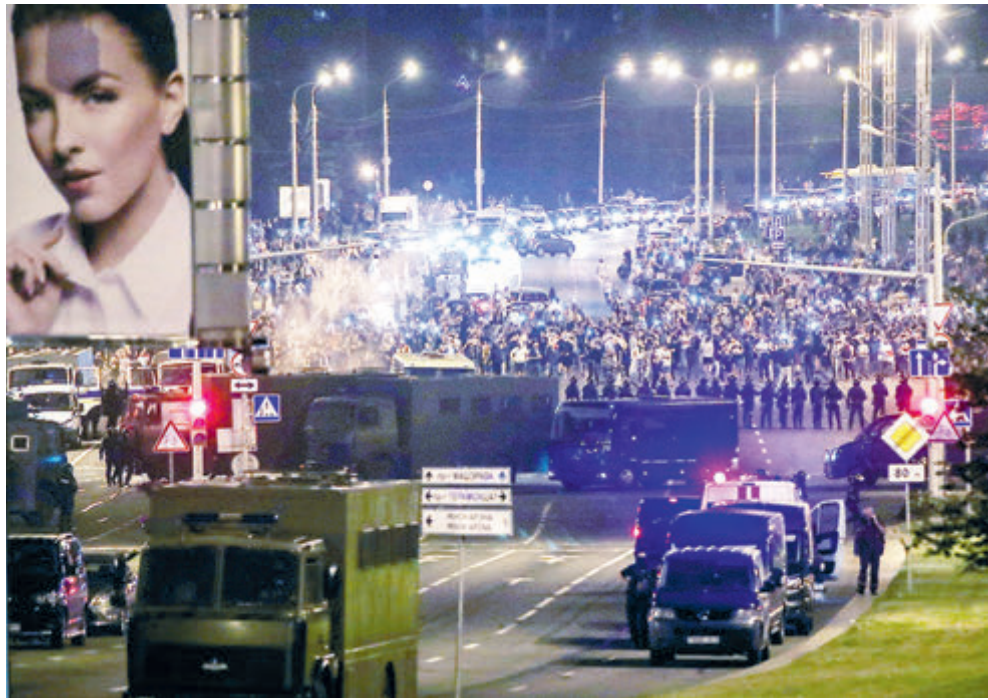
Представить такие картины в Белоруссии еще несколько дней назад было невозможно!

На самом деле эта самая система защищает в Белоруссии не общество, не права и свободы человека, а личную власть Лукашенко, его режим. Об этом, кстати, хорошо сказал Константин Затулин, зампред комитета Госдумы по делам СНГ, отменивший, что президентская кампания Лукашенко в этот раз сопровождалась «тотальной фальсификацией и дезинформацией». Итоговые цифры выборов Затулин без обиняков назвал «надувательством», а самого Лукашенко – «невме-