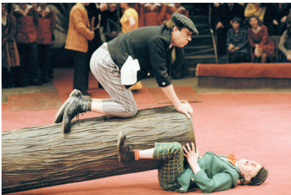
Никулин с Шуйдиным и Олег Попов: три богатыря отечественного цирка.

Какие же они все были разные! Кто-то делал упор на владение различными цирковыми жанрами, как Карандаш, Олег По-