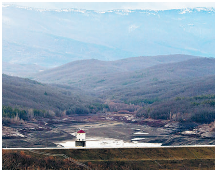
Весна-2021. Загорское водохранилище в Бахчисарайском районе.

В марте наконец-то началось пополнение Симферопольского водохранилища. Там с большим трудом накопили миллион «кубов». Для сравнения: