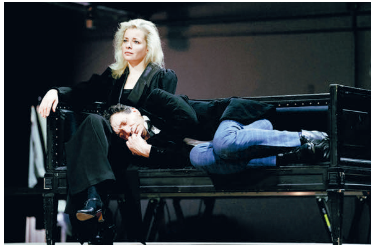
Вахтанговцы первыми открывают нашему зрителю «Обратную сторону медали».

получилось. По каким мотивам Римас Владимирович вызвал меня ассистировать ему на выпуске «Войны и мира», не знаю, но однажды он сказал, что пора бы мне уже поставить что-то самому, и поскорее. По сути, благословил на эту постановку.