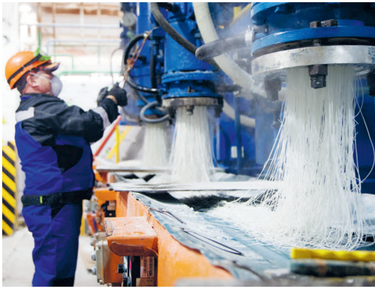
Специалисты «РН-Кат», предприятия НК «Роснефть» в Стерлитамаке, совершили научный прорыв и разработали собственную технологию производства катализатора гидрокрекинга.

Специалисты «РН-Кат», по сути, совершили научный прорыв и разработали собственную технологию