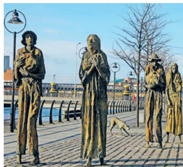
«Голод». Памятник, установленный в Дублине.

Тем временем открываются некоторые интересные подробности. Например, про то, что Служба безопасности Украины готовит провокации в местах хранения зерна. В Днепропетровской области заминировали Просянский элеватор, чтобы его показательно взорвать. В поселке Врубовка на Луганщине на территории зернового комбината демонстративно разместили установки залпово-