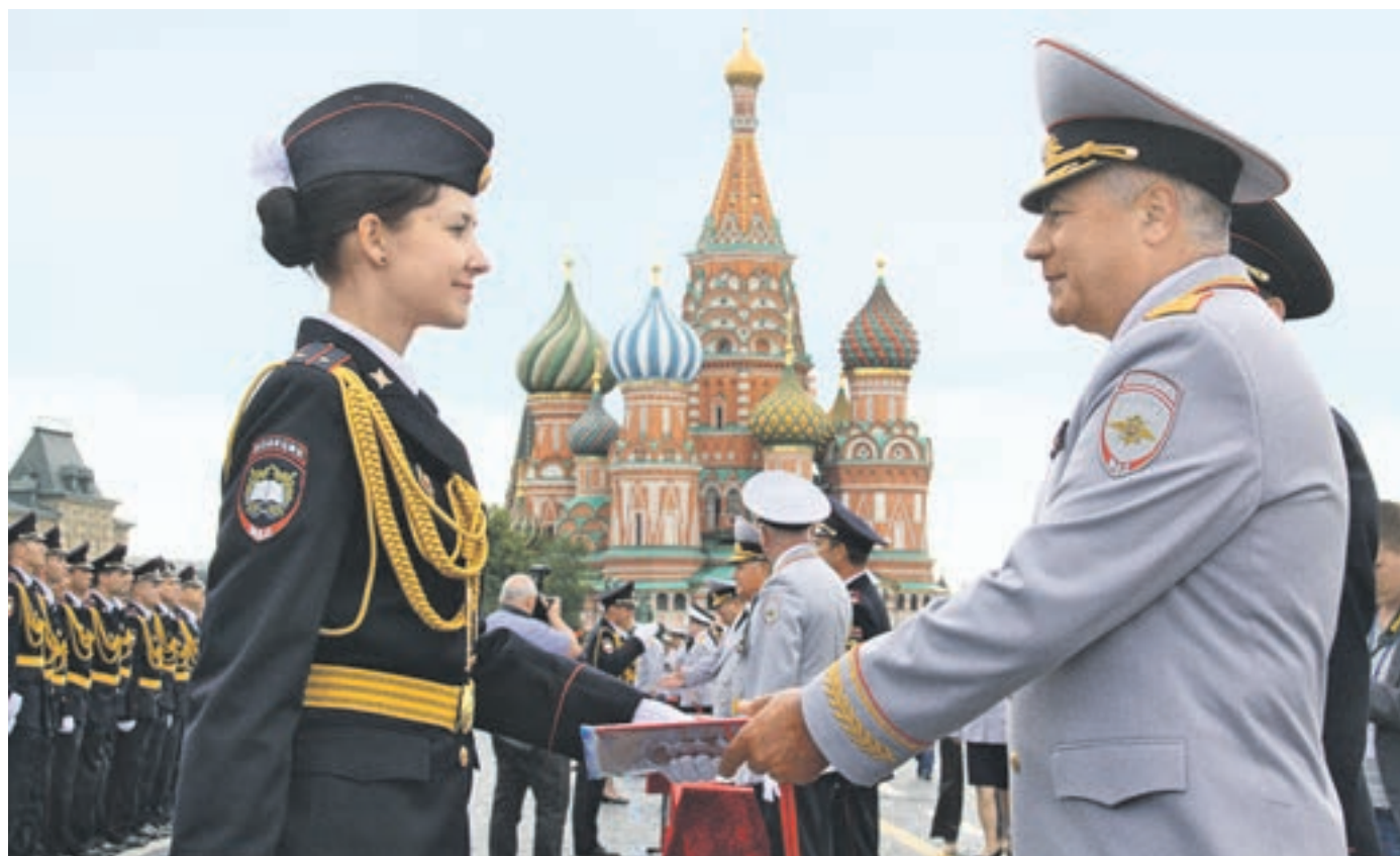
18 июля 2015 года 10:45 Министр внутренних дел России Владимир Колокольцев вручает дипломы выпускникам Московского университета Министерства внутренних дел имени Владимира Кикотя

Московская академия МВД России начинает свою историю с Московской высшей школы милиции МВД СССР, созданной еще в 1974-м. Именно из этих стен выходил цвет отечественной милиции. Время ставит перед будущими Жегловыми и Шарашевыми новые задачи. Поэтому вместе с классическим направлением подготовки оперативных сотрудников и следователей сегодня в университете готовят специалистов в области информационной и экономической безопасности. У курсантов трудовые будни пока впереди, а пока они в отглаженной парадной форме под звуки гвардейского марша выстроились парадным