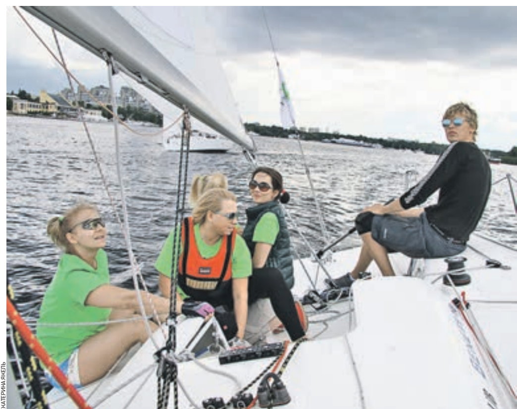
18 июля 2015 года, Химкинский водохранилище 14:25 Дружная команда яхты № 5 на парусной регате убедились, что яхтенный спорт вполне доступен, а эмоции, которые он дарит, точно не забудешь!