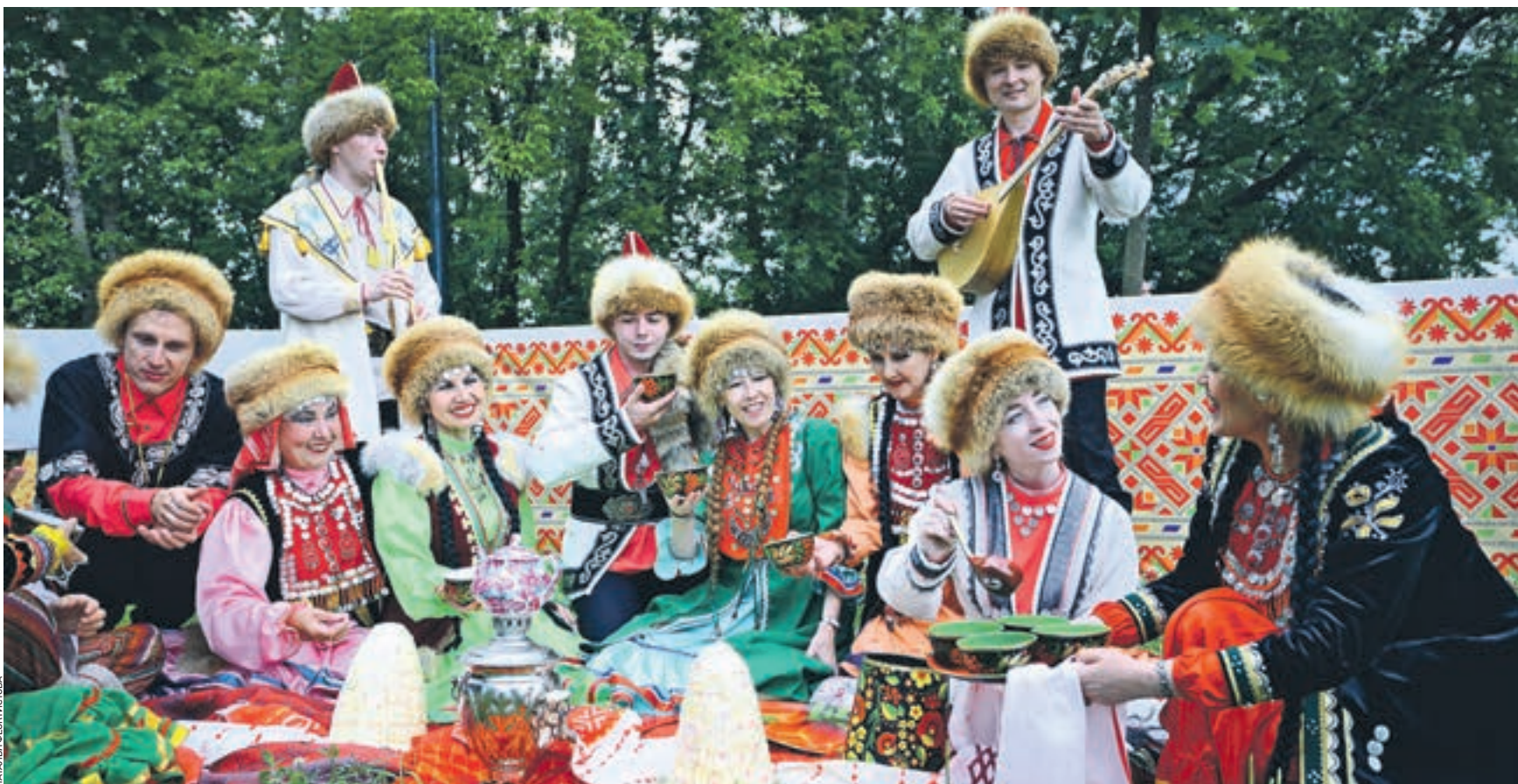
18 июля 13:17 Участники башкирского ансамбля «Ан тирма», что в переводе означает «Белая юрта», на Сабантуе наливали всем желающим чай из самовара в расписные пиалы

■ АННА ПОВАГО a.povago@vm.ru ■ АРТЕМ МУЩЕНКО edid@vm.ru