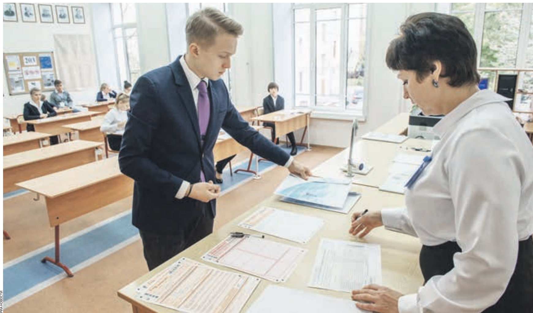
Вчера 11:00 Ученики гимназии № 1529 имени А. Грибоедова во время демонстрационного экзамена получили задания в конвертах, как на настоящем ЕГЭ