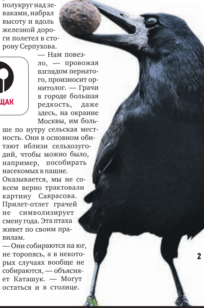
Вчера 09:48 Щербинка, орнитолог Лидия Каташук услышала карканье грача (1) «Птица в черном» нашла чем поживиться (2)