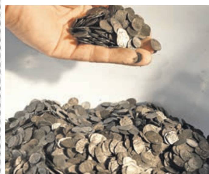
Вчера 16:47 Археолог пересыпает на руке серебряные монеты начала XVII века, которые он достал из фляги, найденной в парке «Зарядье»