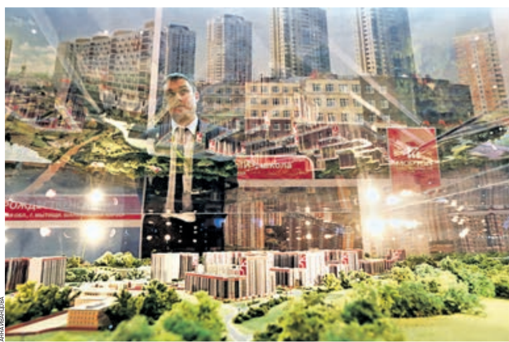
11 декабря 2014 года 14:54 Лучшие городские проекты традиционно презентуют в рамках Урбанистического форума. Некоторые из них представлены в интерактивной форме

Безусловно, не обойти вниманием и тему экономического кризиса. Экспертам предстоит найти наиболее оптимальные и эффективные решения для дальнейшего развития города. Как известно, в Москве реализуется множество различных программ. Многие из них призваны улучшить жизнь горожан. Речь идет в первую очередь о создании удобной и комфортной городской среды.