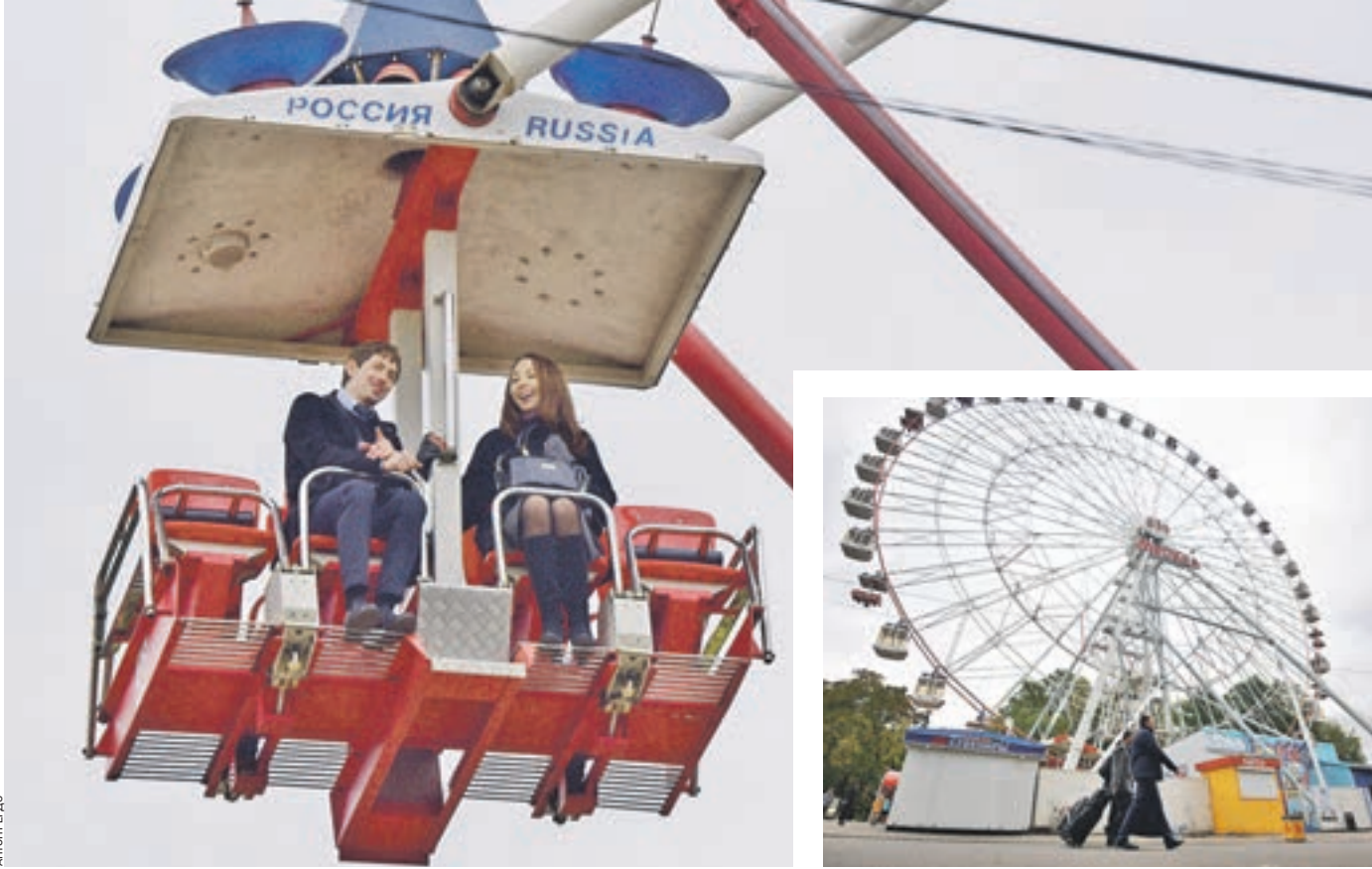
Вчера 16:20 ВДНХ. Горожане и гости столицы активно катаются на колесе обозрения «Москва-850», которое согласно судебному решению должно было быть демонтировано к 15 октября. Приличная стоимость аттракциона не смущает влюбленные пары

ИВАН ПЕТРОВ с ВДНХ 16:00 Несмотря на прохладную погоду, желающих покататься на колесе обозрения на ВДНХ много. Казалось бы, чего тут особенного? Абсурд ситуации в том, что ко вчерашнему дню аттракцион должны были разобрать владельцы по решению Девятого арбитражного суда. «ВМ» поговорила с, возможно, последними посетителями аттракциона и выслушала прогнозы сторон на будущее «колеса преткновения».