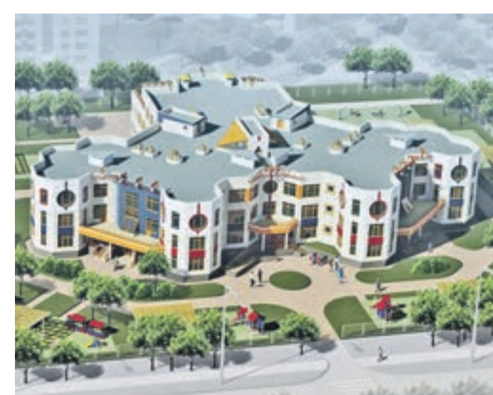
Типовой проект детского сада, который могут посещать 280 малышей. Такое здание уже построено в Бескудниковском районе

Я бы не был столь категоричен. Прежде всего не забывайте, что для строительства типовых проектов примерно половина участков в Москве (по площади, конфигурации, ориентации по сторонам света) изначально не подходит. На такие площадки можно «посадить» только индивидуальные проекты. Если же говорить о типовых, то разнообразие фасадов при одинаковом конструктиве зачастую делает их абсолютно непохожими друг на друга. Когда мы сможем увидеть первые построенные здания? Хотя сегодня! Проекты уже реализуются. Один из них — детский сад на 280 мест — стоит уже по четырем адресам. И никто не упрекнул нас в том, что Москва строит одинаковые сады. Именно вариативность фасадов придавала каждому из объектов неповторимый облик. В числе ваших разработок есть уникальный проект. Верно, это не имеющее аналогов здание-трансформер, способное за короткое время и за очень небольшие деньги, по сравнению с новым строительством, полностью или ча-