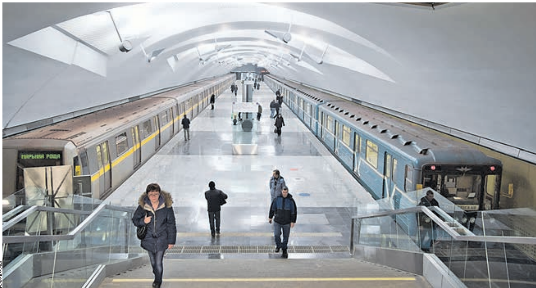
2 декабря 2011 года. Первый день работы станции метро «Шпилевская» Люблинско-Дмитровской линии. Она функционирует в нормальном режиме, несмотря на ряд серьезных финансовых нарушений, допущенных при ее строительстве. К счастью, хищения на качество работ не сказались.