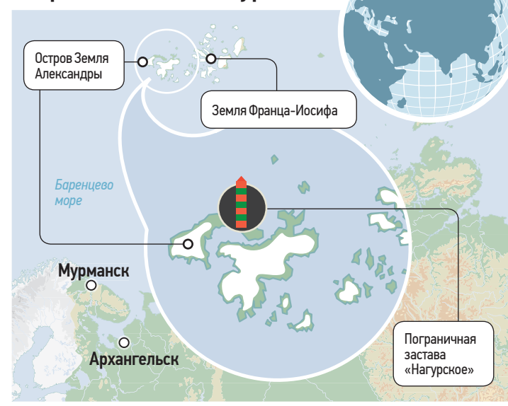
Схема расположения погранзаставы «Нагурское»