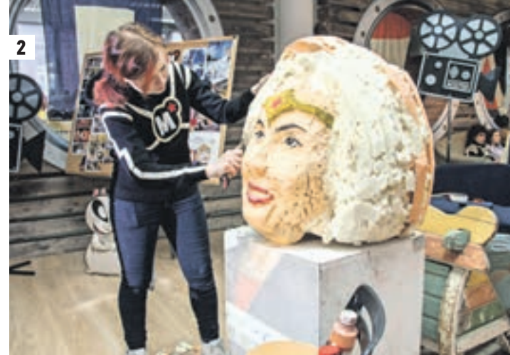
Вчера. Сани-птеродактиль собраны студентами МХПИ за две недели. Крылья «птеродактиля» оснащены автоматическим приводом, который позволяет им двигаться (1) Хиллари Клинтон возглавит женский санный экипаж команды МХПИ (2)