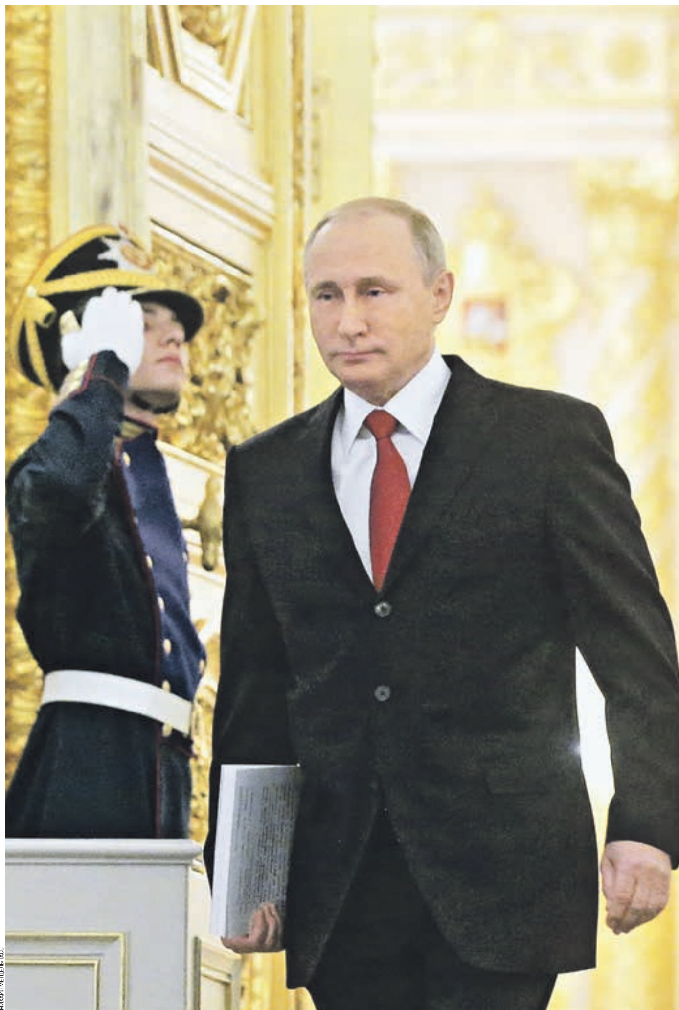
Вчера 11:55 Кремль. Президент Российской Федерации Владимир Путин входит в Георгиевский зал Кремля, чтобы через пару минут обратиться с ежегодным посланием к Федеральному собранию

Также в своем выступлении президент России Владимир Путин затронул тему выхода на глобальные мировые рынки, а еще напомнил об участившихся в последнее время попытках давления на нашу страну извне.