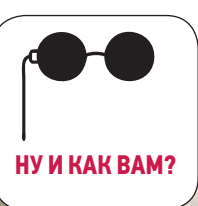
НУ И КАК ВАМ?