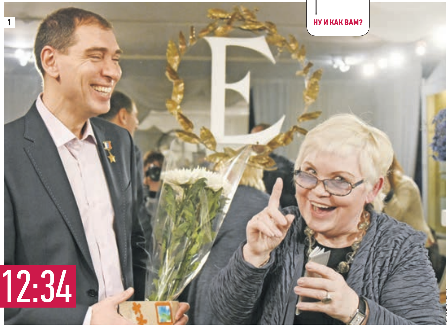
1 Вчера. Известный космонавт, Герой России Сергей Волков передает в дар директору Музея Есенина Светлане Шетраковой сборник стихотворений поэта (1) Книга побывала вместе с ним на Международной космической станции (2)