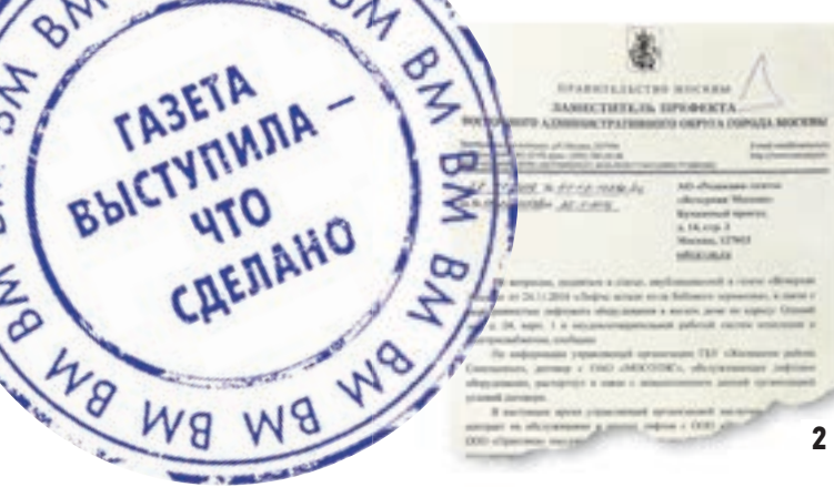
Вчера, Олений Вал, 24, к. 1. Екатерина Лавыгина рада отремонтированному лифту (1) Ответ префектуры ВАО на публикацию «ВМ» (2)