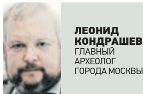
ЛЕОНИД КОНДРАШЕВ ГЛАВНЫЙ АРХЕОЛОГ ГОРОДА МОСКВЫ

Кажется, что достопримечательности Москвы, включая площади и прогулочные зоны, давно стали символами Москвы и существовали всегда. Однако первые такие территории были организованы только после наполеоновского нашествия и московского пожара 1812 года. Одна из них — Александровский сад. Чтобы понять, как проходило благоустройство этой территории, надо сказать, что Московский Кремль, согласно принципам фортификации, был возведен на месте слияния двух рек — Неглинной и Москвы-реки. С развитием города Неглинная стала использоваться для локации мельниц. Речку запрудили, в нижнем течении она превратилась в каскад прудов. Около плотин появились переграва, уже в наше время археологи раскопали там срубы XIII века. В конце XV века все постройки разобрали, чтобы огонь в случае пожара не дошел до дворцов и соборов. После переноса Петром I столицы в Петербург эти территории заселили небогатые люди, и район криминализировался. Знаменитый криминальный трактир «Скачок» располагался именно там.