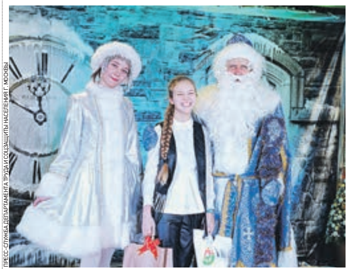
7 декабря 15:40 Подарки от москвичей юным участникам акции «Дерево желаний» вручили Дед Мороз и Снегурочка