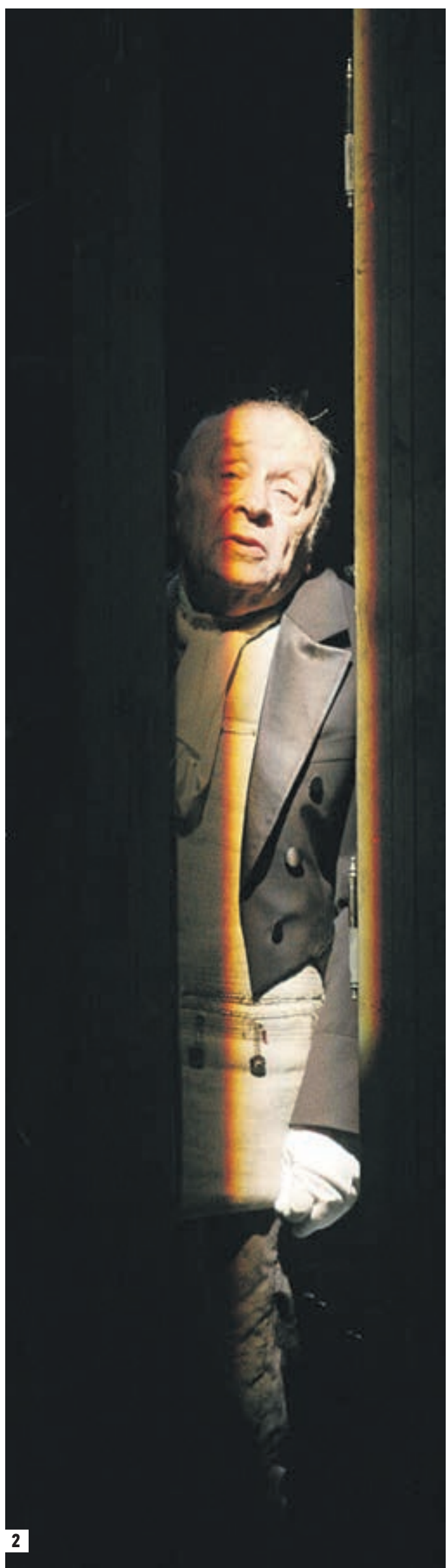
1973 год. Кадр из фильма «Семнадцать мгновений весны». Леонид Броневой в роли группенфюрера СС Генриха Мюллера (1) 2009 год, Леонид Броневой в постановке «Вишневый сад» «Ленкома». Неподражаемый Фирс (2)

В те годы после окончания вузов студенты распределяли на работу. Так Броневому и выпало поработать в разных театрах — в Оренбурге, Магнитогорске, Воронеже, Иркутске. Это была фантастическая школа — это были довольно мощные театры с традициями. Да и время тогда было театральное — в отсутствие интернета залы были набиты битком... Но Броневой грешил Москвой, столичная театральная школа казалась ему верхом всего. Его мечта сбылась в 1961 году, по сути — с наступлением оттепели. Вернувшись в столицу и устроившись на работу в Театр на Малой Бронной, очень скоро Леонид Броневой занял в нем ведущие позиции. Стало модным ходить «на Бронную, на Броневского». В это время в театральном мире шли большие подвижки: сменились режиссеры, миграция