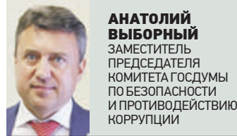
АНАТОЛИЙ ВЫБОРНЫЙ ЗАМЕСТИТЕЛЬ ПРЕДСЕДЕЛЯТЕЛЯ КОМИТЕТА ГОСУДАРСТВА ПО БЕЗОПАСНОСТИ И ПРОТИВОДЕЙСТВИЮ КОРРУПЦИИ

Безусловно, это не новый этап борьбы, но продолжение процесса. Мне очень хочется надеяться, что количество антикоррупционных нарушений в стране пойдет вниз. С 2008 года, когда Государственная дума приняла базовый закон о борьбе с коррупцией, утверждено более ста нормативных актов только федерального уровня, половина из них — законы, имеющие антикоррупционную направленность. Необходимо отметить, что кроме нормативной базы были созданы и организационные механизмы. В каждом органе государственной власти сегодня есть антикоррупционное подразделение. Есть лица, которые обязаны контролировать исполнение законодательства и пресекать коррупционные действия. Сегодня создана и система, при которой совершать коррупционные преступления невозможно, ведь даже спустя несколько лет наступит неминуемое возмездие. Уверен, что будет сформирована высокая правовая культура, а гражданская ответственность будет достаточной, чтобы каждый понимал, что быть коррупционером не только опасно и невыгодно, но еще и позорно.