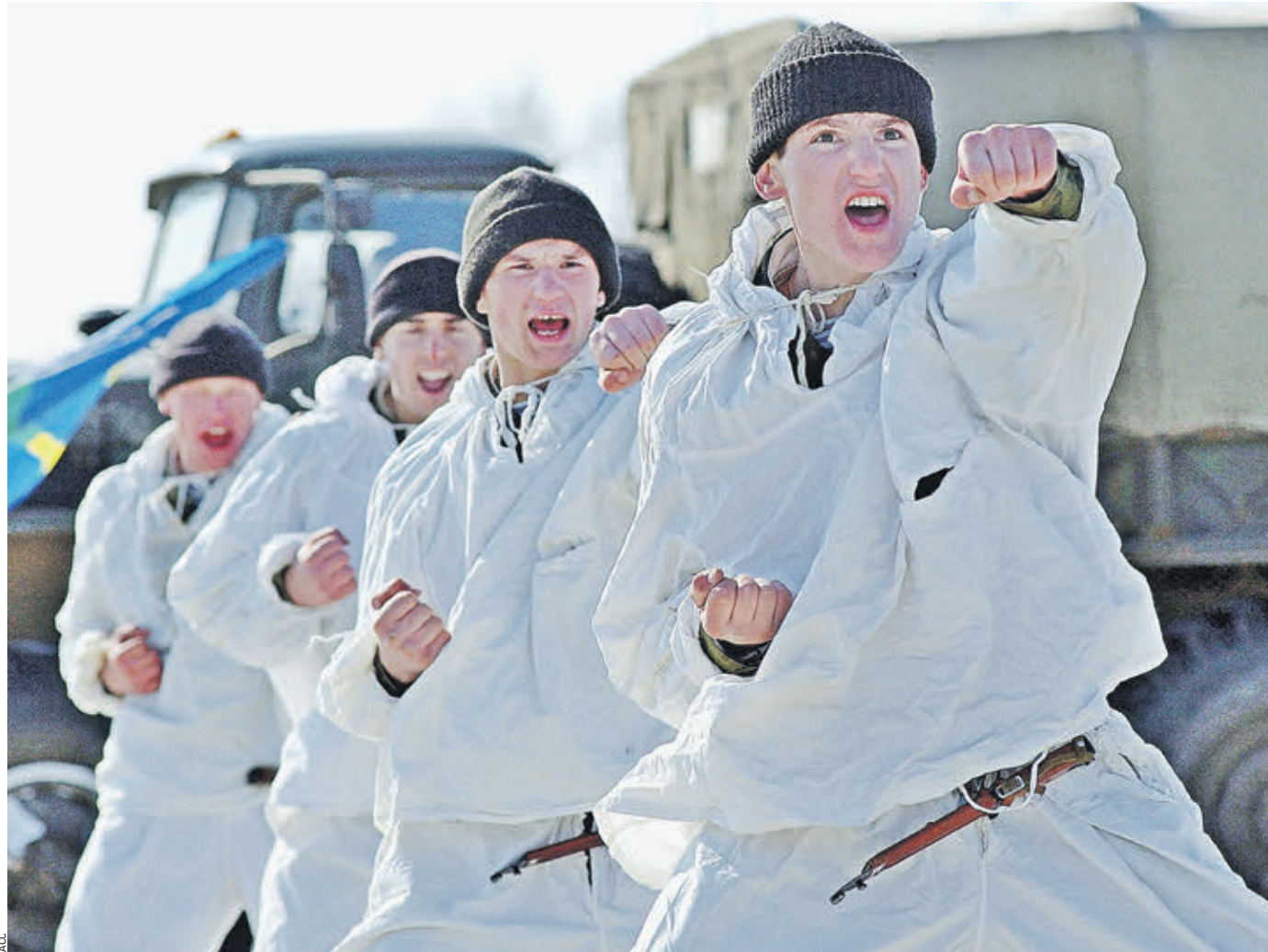
12 апреля 2018 года. На полигоне в подмосковной Кубинке в честь Дня космонавтики проходит показательное выступление разведчиков воздушно-десантных войск

Рейтинг экспертов организации Global Firepower опубликован на портале Business Insider. Вообще-то эта социолого-статистическая «конторка», как и ее неведомые миру эксперты, — лошади очень темные. Впрочем, Global Firepower уже изначально не берет на себя ответственность за точность и достоверность информации. Даже на сайте этой организации написано, что проект выполняет «историческую и развлекательную функцию». Составленный рейтинг имеет статус ежегодного. Как и в 2017 году, список «суперов» возглавили США, Россия и Китай. Отмечается, что эксперты оценивали боевую мощь по 55 критериям, ключевые из которых — «численность войск, наличие рабочей силы, географическое положение, разнообразие вооружения, доступность к природным ресурсам и уровень развития промышленности». Численность нашей армии определена в 3 586 128 человек — вместе с военнотехническими запасами. Вообще-то, по официальным данным, штатная численность Вооруженных сил России составляет 1 013 628 человек. А запасников, способных встать под ружье в случае необходимости, в нашей многомиллионной стране уж точно не 2,5 миллиона, а намного больше. Перечислять и сравнивать количество танков, самолетов и кораблей смысла нет. В су-