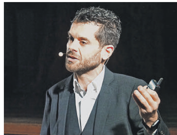
14 ноября 2019 года. Генконсул Италии Франческо Форте читает «Божественную комедию» Данте Алигьери

Чтение и комментирование проводится на итальянском языке с синхронным переводом на русский. Несмотря на то что Данте писал 700 лет назад, его бессмертное творение актуально и в наши дни. Комедия наполнена аллегориями: в ней говорится о тех ценностях и стремлениях, которые прищипывают человеку любой эпохи. Ведь люди всегда остаются людьми. Вот он — сумрачный лес, аллегория жизни. Поэт сделал шаг в сторону с верного пути и не знает, как вернуться... К нему на помощь приходит поэт Вергилий, который символизирует будущий Ренессанс, натурфилософию и классику римской литературы.