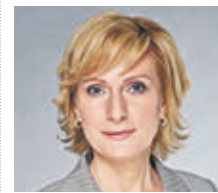
ИННА СВЯТЕНКО ЧЛЕН СОВЕТА БЕДЕРАЦИИ РФ

в Питер и завели в каждой семье самогонный аппарат. Но изменить социальную структуру, привычки гораздо сложнее, чем просто ограничить. Побочный эффект подобных мер, помимо коррупции на местах и увеличения нелегального оборота, — люди начнут пить неконтролируемые суррогаты.