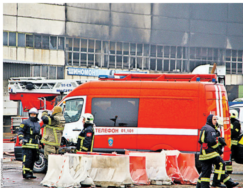
Вчера 11:08 Строгино. Столичные пожарные потушили крупное возгорание. Утром, в 9:39, в столичное управление МЧС поступил сигнал о пожаре в нежилом трехэтажном здании по улице Маршала Прошлякова, 20. Пожарно-спасательные подразделения уже в 9:45 прибыли на место. Огонь распространился на 600 квадратных метров. Тушили здание с нескольких сторон. В 10:58 пожар был ликвидирован. Были задействованы 22 единицы техники и 60 спасателей.