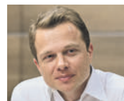
МАКСИМ ЛИКСУТОВ ЗАМЕСТИТЕЛЬ МЭРА МОСКВЫ, РУКОВОДИТЕЛЬ ДЕПАРТАМЕНТА ТРАНСПОРТА И РАЗВИТИЯ ДОРОЖНО-ТРАНСПОРТНОЙ ИНФРАСТРУКТУРЫ МОСКВЫ

Добавилось более тысячи новых велосипедов, а в следующем году мэр Москвы Сергей Собянин поручил увеличить их количество еще почти на тысячу единиц, из которых более половины будут электрическими. По количеству поездок на один велосипед Москва — один из городов-лидеров в мире. В среднем один пользователь велопроката преодолел 18 километров. Ежедневно пользователи совершили 24,5 тысячи поездок. И это очень приятная статистика. Мы видим, что для москвичей велосипед стал удобным и востребованным транспортным средством. Мы постоянно анализируем, где станции велопроката больше всего востребованы. Наиболее активные пользователи велопроката — это жители Хамовникова и Тверского района. Кроме того, мы готовы выслушать предложения москвичей о том, где стоит установить новые станции в следующем году.