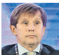
ИГОРЬ КОСАРЕВ ПРЕЗИДЕНТ СОЮЗА ПРОИЗВОДИТЕЛЕЙ АЛКОГОЛЬНОЙ ПРОДУКЦИИ

Не очень хорошая идея. Алкоголь — подакцизный товар. В бутылке за 215 рублей примерно 140 из них составляют акцизы и НДС. Как только сокращаются легальные каналы реализации, то увеличивается число нелегальных. Общий объем нелегального оборота сейчас около 35–40 процентов от легального оборота. В этом году будет продано 84 миллиона декалитров водки, а нелегально оборачивается еще 40.