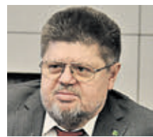
ЕВГЕНИЙ БРЮН ГЛАВНЫЙ ВНЕШТАТНЫЙ ПСИХИАТР-НАРКОЛОГ МИНЗДРАВА РФ

Мы часто ездим по стране с популяризацией здорового образа жизни и видим, что во многих регионах алкоголь продается до 22 часов. Удивлен, что такая мера еще не введена в Москве. Сокращение времени продажи алкоголя на час улучшит обстановку на дорогах — будет меньше ДТП по вине пьяных водителей, обстановку в семьях — станет меньше бытовых конфликтов и так далее. Другой вопрос, что подобную меру нужно сочетать с усилением преследования за нелегальную торговлю алкоголем. В отношении нелегальных продавцов нужно ввести уголовную ответственность. Тогда правоохранительные органы и чиновники на местах начнут наводить порядок.