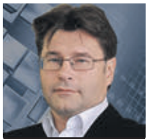
АЛЕКСЕЙ МУХИН политолог

Русский мир со стороны России — это попытка защитить русских, которые живут по всему миру, особенно в бывших странах СНГ. Это актуальная тема, которая постоянно возникает во время всяческих конфликтов на постсоветском пространстве. Но проблема в том, что восприятие русского мира нашими западными коллегами базируется исключительно на мнении, что это «попытка восстановления СССР». То есть мы понимаем это как защиту соотечественников за рубежом, а они — как элемент агрессии. Для них это даже не «мягкая сила», а именно агрессия! Причем такая же позиция не только у западных, но и у восточных партнеров, просто они умнее и не говорят об этом вслух. Запад кричит, Восток молчит. А позиция одинаковая. Часть коррумпированного истеблишмента бывших советских республик действительно во многом зависит от КНР и Южной Кореи. Это такая обычная практика: ты захватываешь определенными инструментами часть элиты, и страна начинает терять суверенность. Но к самой стране, к гражданскому обществу, это отношения не имеет. Та же Украина от нас ни в коем случае не отказывалась! Отказалась часть ее истеблишмента, которая пытается навязать точку зрения меньшинства всему остальному гражданскому обществу страны. Да,