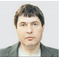
АЛЕКСАНДР ЛОСОТО ОБЗОРЩИК

Мнение колумнистов может не совпадать с точкой зрения редакции «Вечерней Москвы»