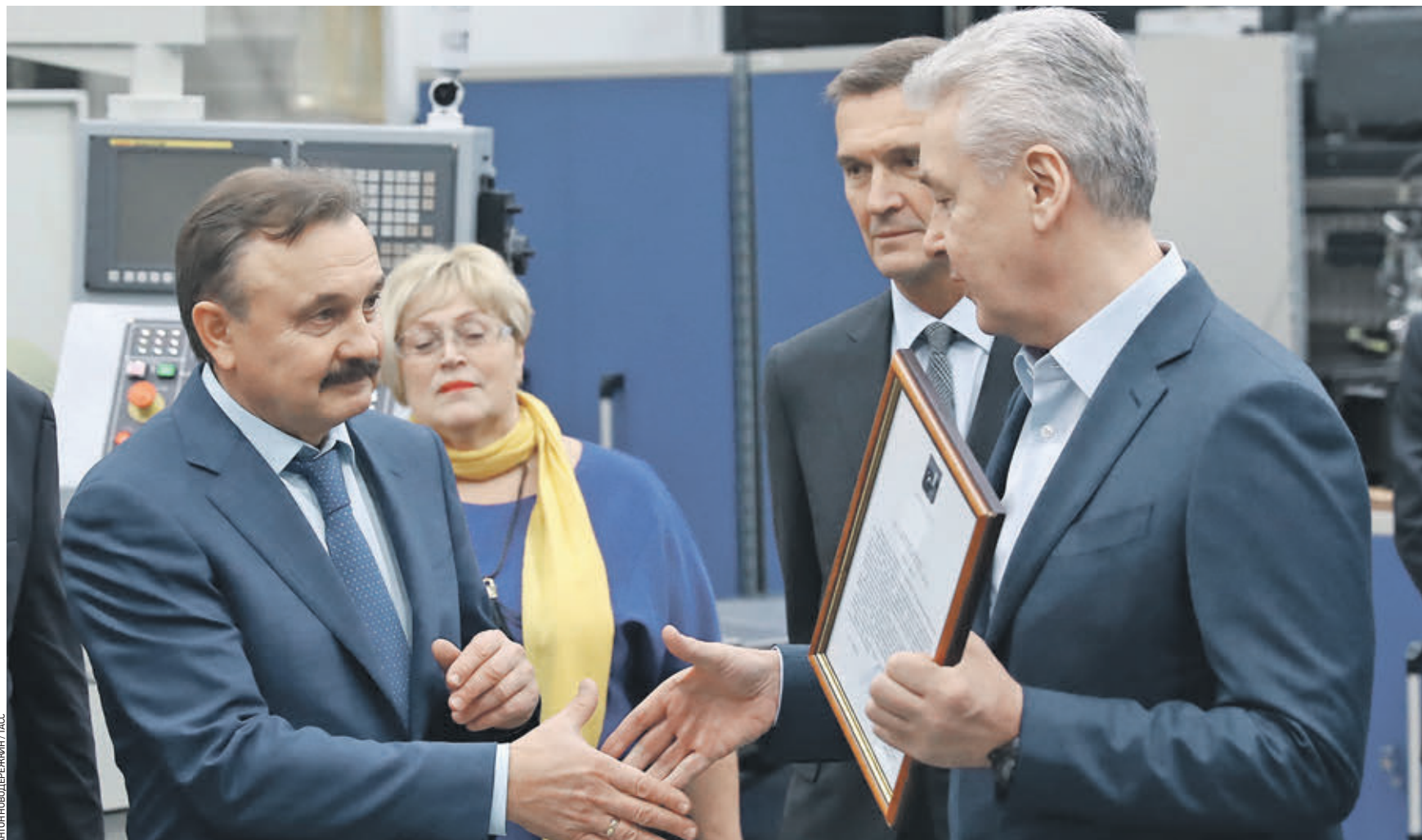
Вчера 13:07 Мэр Москвы Сергей Собянин (справа) поздравляет коллектив государственного машиностроительного конструкторского бюро «Вымпел» имени Ивана Торопова с 70-летием и вручает генеральному директору Николаю Гусеву поздравительный адрес