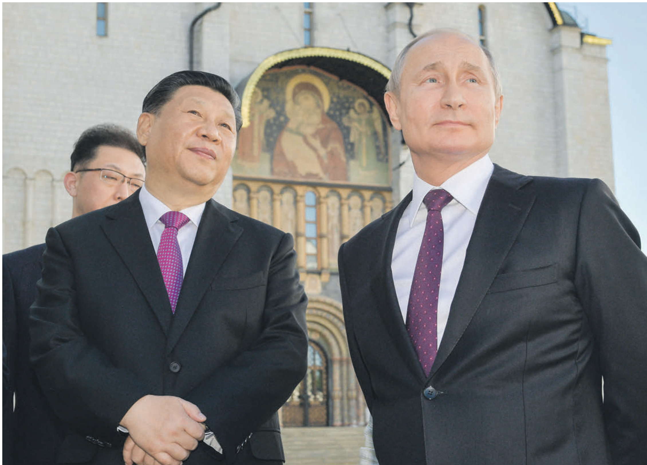
5 июня 2019 года. Московский Кремль. Председатель Китайской Народной Республики Си Цзиньпин и президент России Владимир Путин (слева направо) во время официальной встречи

Масштабные перемены начались в 1978 году с провозглашением «политики открытых дверей» и поначалу ограниченных рыночных реформ. Как сформулировал их принцип главный идеолог реформ Дэн Сяопин, «неважно, какого цвета кошка, лишь бы она ловила мышей» (где «кошка» — форма собственности). Любопытно, что эту формулу он впервые употребил еще в 1962 году. Это символично в том плане, что