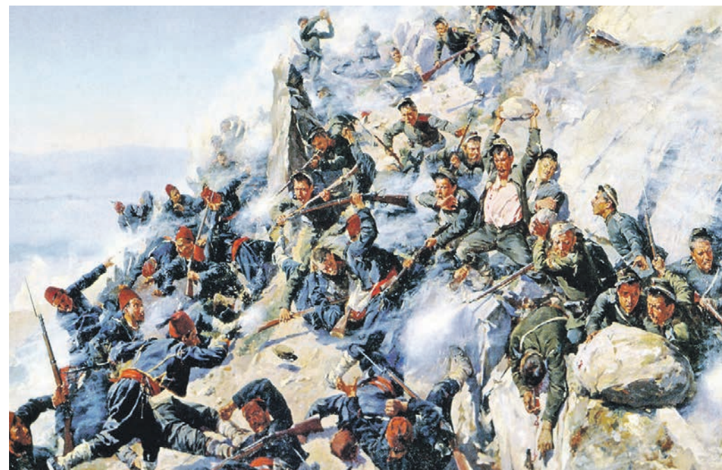
1873 год. «Защита «Орлиного гнезда» орловцами и брянцами в августе 1877 года». Картина Алексея Попова. Битва на Шипке вдохновила многих русских художников

Доктрина «Москва — Третий Рим» предполагает, что русский православный царь отвечает за всех православных мира. И он обязан за них наступать, если на них нападают. Мы защищали болгар и грузин от турок. Позднее пытались защищать сербов от НАТО. Ну и, разумеется, попутно отстаивали наши геополитические интересы. Одно другому не мешает.