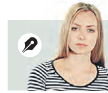
ВАСИЛИСА ЧЕРНЯВСКАЯ Специальный корреспондент «Вечерней Москвы»

После 2025 года объемы вырастут до трех миллионов квадратных метров ежегодно. Здесь важно не только утвердить эти самые «квадраты», но и учесть ситуацию на рынке: как будет формироваться стоимость стройматериалов, какая ситуация сложится на рынке труда в строительной индустрии, какие риски может нести подрядчик. Прочность столичного Стройкомплекса позволяет быть уверенными в том, что программа реновации пройдет строго по графику.