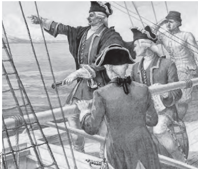
1950 год. Картина «Русские мореплаватели у берегов Аляски» художника Виктора Свешникова

Путь от центра России до побережья Тихого океана составлял в то время около двух лет, что не способствовало эффективному управлению такими отдаленными территориями. Тем не менее осваивать и заселять их было необходимо.