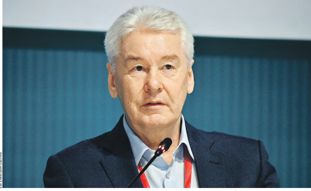
Вчера 17:27 Мэр Москвы Сергей Собянин на пленарной сессии Петербургского международного экономического форума

Мэр Москвы отметил, что в нынешней постиндустриальной экономике человеческого капитал занимает первое место,