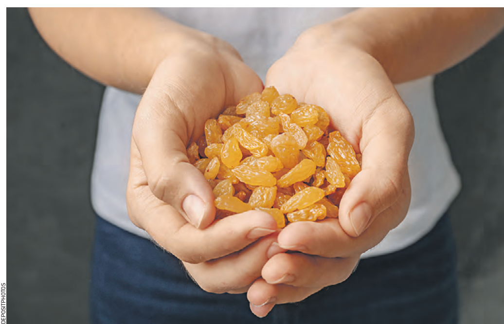
21 мая 2021 года. Москвичка держит в ладони светлый изюм. Для получения золотистого цвета продукт обрабатывают диоксидом серы. Это разрешенная добавка