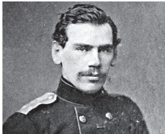
1852 год. Лев Николаевич Толстой во время военной службы на Кавказе

Сам же Николай Некрасов (кстати, Толстой был крайне недоволен тем, что название повести без его ведома изменили) вскоре писал молодому автору: «Я люблю в вас великую надежду русской литературы, для которой вы уже много сделали и для которой еще более сделаете, когда поймете, что в нашем отечестве роль писателя есть прежде всего роль учителя и по возможности заступника за безгласных и приниженных». За несколько лет до этого примерно с такими же словами обратился к другому молодому автору, Федору Достоевскому, Виссарион Белинский, прочитав в рукописи его повесть «Бедные люди»: «Вам правда открыта и возведена как художнику, досталась как дар. Цените же ваш дар, оставайтесь верны правде и будете великим художником». Белинский и Некрасов не ошиблись. Трилогия Льва Толстого «Детство», «Отрочество», «Юность», как и повесть Федора Достоевского «Бедные люди», на годы вперед определили «направление», как писали в то время, классической русской литературы. Оба эти произведения были новаторскими. Никогда еще никто из русских писателей не писал с такой проникновенностью о страданиях униженных и оскорбленных, как никто и не погружался с таким душевным трепетом и внима-