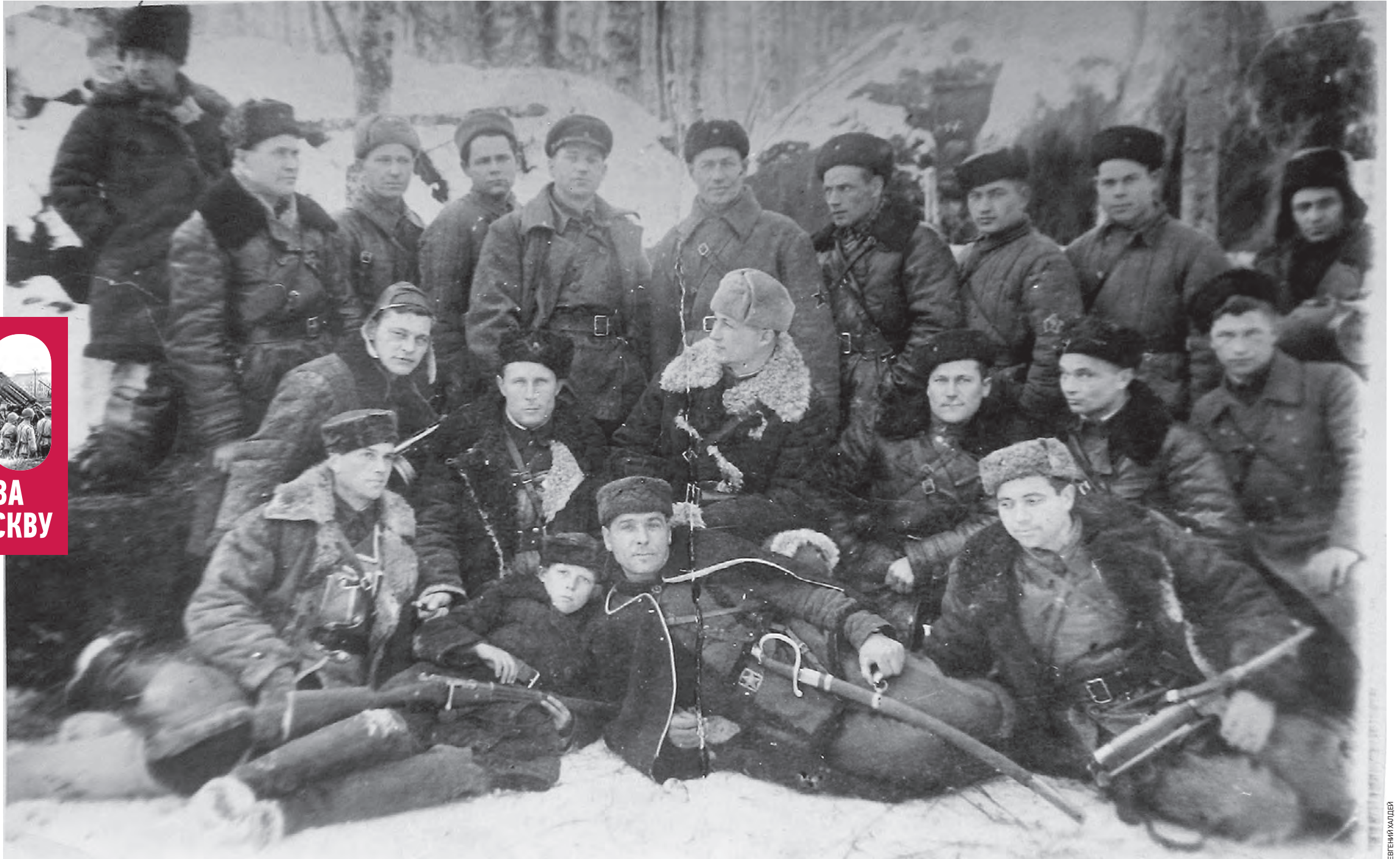
1941 год. Бойцы отряда «Славный» — специального подразделения Отдельной мотострелковой бригады НКВД СССР

— Личный состав столичной милиции охранял общественный порядок в городе во время налетов вражеской авиации, укрывал население в бомбоубежище по сигналу воздушной тревоги, ликвидировал последствия налетов, охранял от мародеров имущество граждан в постра-