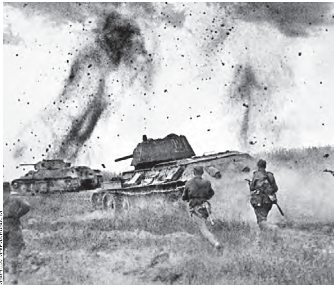
6 июля 1943 года. Курская дуга. Атака соединений 5-й гвардейской танковой армии в районе Прохоровки