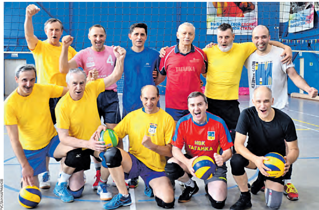
7 августа 14:50 Участники поединка любительских команд ветеранов «Ильинка» — «Таганка», посвященного дню рождения отечественного волейбола