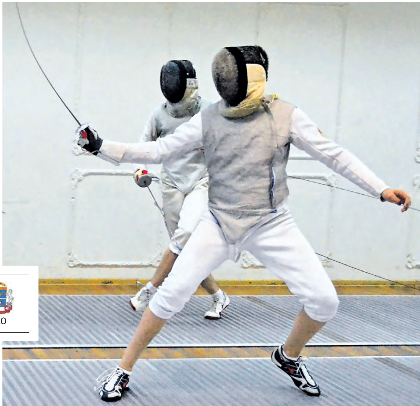
7 августа 13:14 ЛФК ЦСКА. Тренировка юных рапиристов армейского клуба, может быть, будущих олимпийских чемпионов Игр в Париже-2024