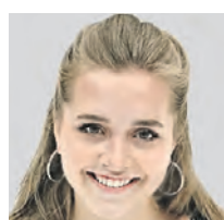
ЕЛЕНА РАДИОНОВА БРОНЗОВЫЙ ПРИЗЕР ЧЕМПИОНАТА МИРА

Мне очень нравится сегодня катание россиянки Алены Косторной и японки Рики Кихири. Мне интересно наблюдать за тем, как девочки исполняют четверные прыжки. Но хочется оценить не только сложность прыжков, но и женственность фигуристок. Наш вид спорта очень полюбился. Да, женскому одиночному катанию немного не хватает женственности, но вот Косторная и Кихира очень хорошо владеют этой составляющей.