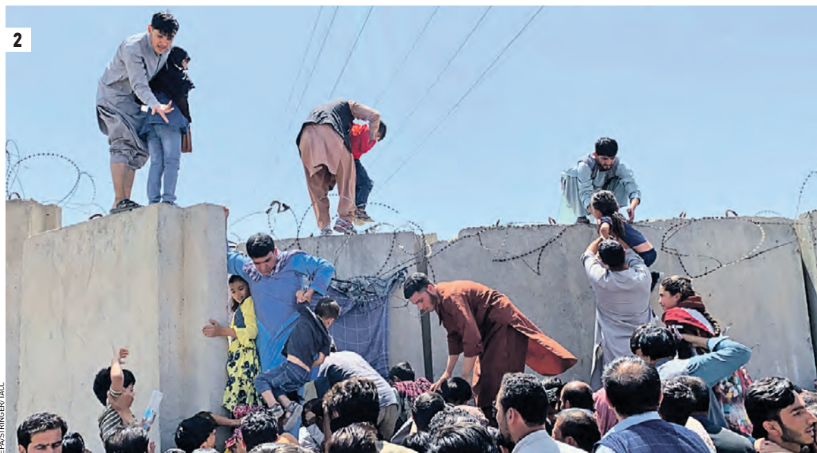
17 августа 2021 года. Боевики движения «Талибан» (запрещенного в России) вошли в Кабул и объявили о взятии под контроль всей территории Афганистана (1) 16 августа 2021 года. Ситуация у международного аэропорта имени Хамида Карзая в Кабуле: люди пытаются покинуть страну, захваченную талибами (движение «Талибан» запрещено в РФ) (2)

В унисон прозвучало и заявление его советника по национальной безопасности Джейка Салливана: «Никто в администрации президента не ожидал, что правительственная армия республики так быстро сдастся. Несмотря на то, что мы потратили 20 лет и десятки миллиардов долларов на предоставление силам безопасности Афганистана лучшего оборудования, лучшей подготовки и лучших возможностей, мы не смогли наделить их желанием сражаться». Цинизм — запредельный. Откровенная «спихотехника». Афганскую армию обучали военные инструкторы США, они расставляли в ней командные кадры. Американцы сами же и деморализовали эти войска, начав переговоры с Движением талибов. Ситуация глазами афганского солдата: если враг уже не враг, а партнер по переговорам, то зачем мне идти в бой и умирать сегодня, если завтра американцы обещают обеспечить с талибами режим «мир, дружба, жвачка»? В результате талибы заняли всю страну и получили в виде трофеев тысячи единиц оружия, современной военной техники и многие тонны всегда здесь дефицитных горюче-смазочных материалов. Можно воевать хоть с десятком лет. Вопрос: с кем?