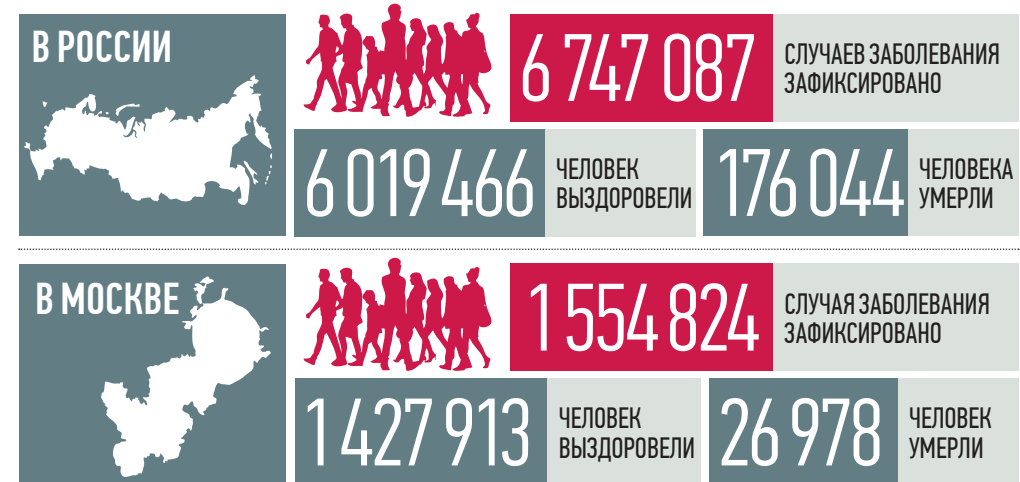
По данным стопкоронавирус.рф и mos.ru на 19:00 22 августа

Противоэпидемические меры и требования для российских университетов в новом учебном году не изменятся, сообщил вчера глава Министерства науки и высшего образования РФ Валерий Фальков в интервью телеканалу «Россия-24». Это термометрия, санобработка помещений, социальная дистанция и средства защиты.