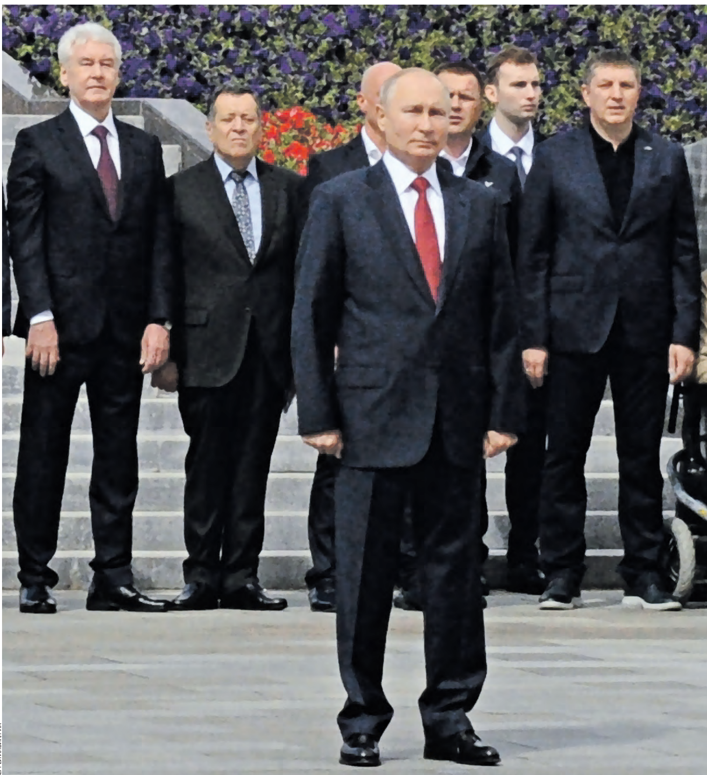
Вчера 12:15 Президент России Владимир Путин (на переднем плане) и мэр Москвы Сергей Собянин (слева) посетили торжественную церемонию поднятия Российского триколора около Музея Победы. Полотнище взлетело вверх на флагшток под звуки бравого марша «Славься», который исполнили музыканты Президентского оркестра