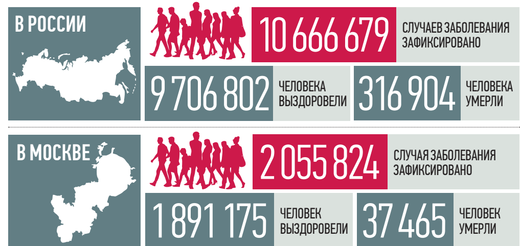
По данным стопкоронавирус.рф и mos.ru на 11:30 10 января