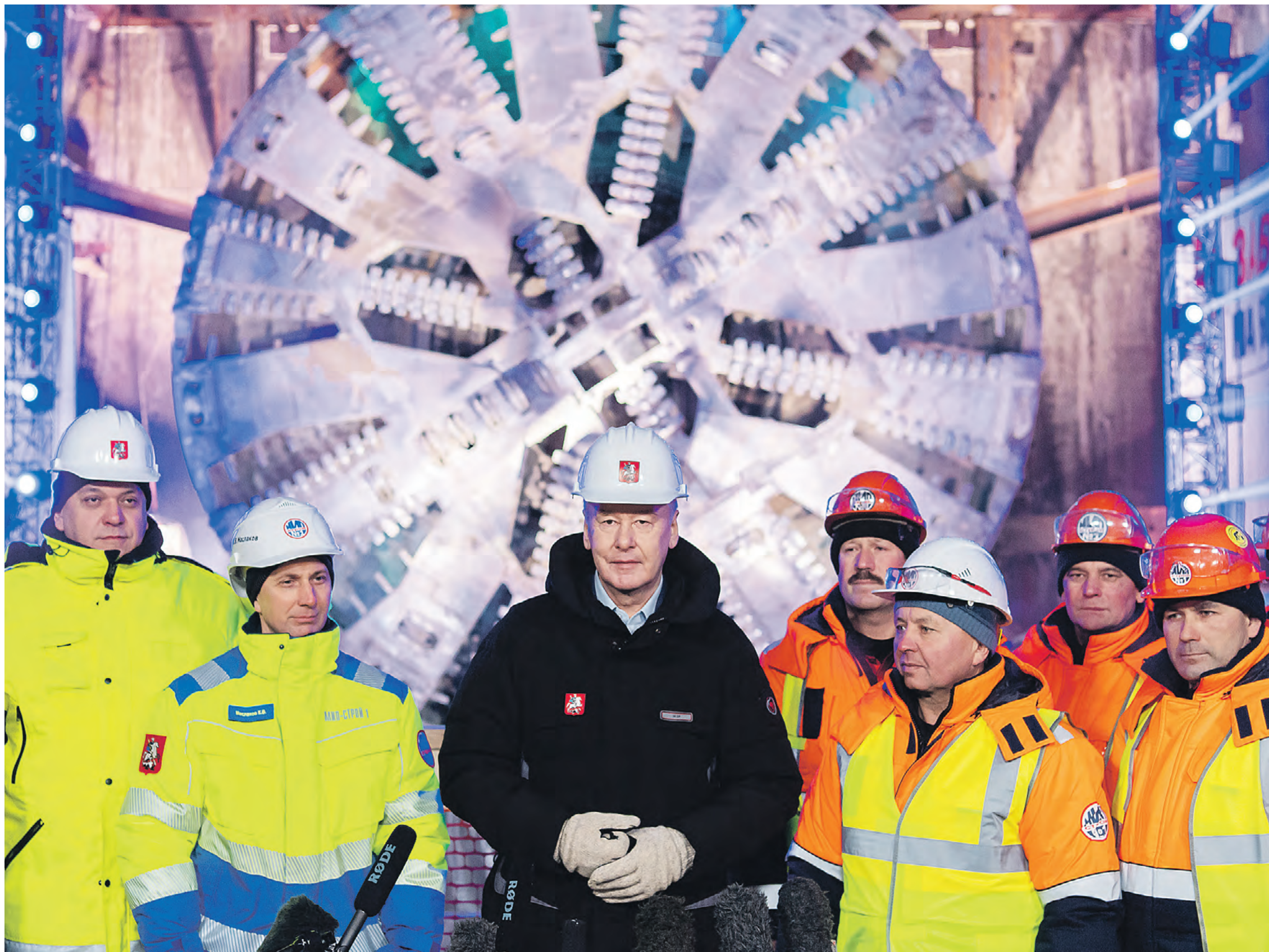
29 декабря 2021 года 14:48 Мэр Москвы Сергей Собянин (в центре) и коллектив метростроителей на церемонии завершения проходки тоннелей Большой Кольцевой линии столичного метро

В ходе выступления перед депутатами Мосгордумы мэр Москвы Сергей Собянин подчеркнул, что по итогам девяти месяцев 2021 года, несмотря на пандемию и связанные с ней сложности, рост инвестиций в столице составил 21,9 процента. В обрабатывающих отраслях рост производства составил 23,4 процента, а оборота в торговле — 11,8 процента. Вместе с тем на естественный уровень вернулась безработица, сократившись в сравнении с максимумами прошлого года в шесть раз.