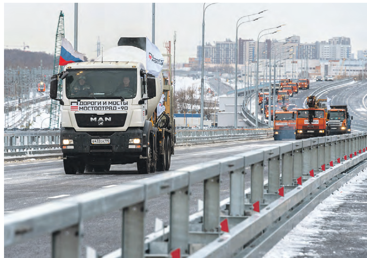
2 декабря 2021 года 16:11 Строительная техника, участвовавшая в строительстве Северо-Восточной хорды, прошла парадом по объекту

раз не рисковать подхватить ковид. Даже если это будет дольше по времени либо надо будет заплатить за платную дорогу. И людей можно понять. В 2010 году мы начинали с пропорции — примерно 60 процентов всех поездок совершалось в общественном транспорте. 40 процентов — на автомобиле. Потребовалось почти 10 лет ежедневной работы, чтобы уговорить часть автомобилистов пересесть на общественный транспорт. К концу 2019 года мы имели более правильную пропорцию 70:30 в пользу общественного транспорта. Но пандемия нас отбросила в исходную точку — автомобиль вернул свою долю в 40 процентов. И это, конечно, не очень хорошо для города и горожан. Что можно сделать, чтобы вернуть пассажиров на общественный транспорт? Продолжать строить новые станции метро и МЦД, выводить на линии новые вагоны и электробусы, улучшать возможности для пересадок. Пандемия же не вечная. Когда она закончится, люди увидят, что за эти годы общественный транспорт не деградировал. Наоборот, стал лучше, удобнее, привлекательнее. И я уверен, пассажиры вернуться. Так и сейчас происходит. Когда в декабре мы открыли 10 новых станций БКЛ, несколько десятков человек впервые стали регулярно ездить на метро. До запуска БКЛ они вообще не пользовались общественным транспортом или пользовались им очень редко по разовым билетам. Но как-то же они раньше ездили? Вероятно, на такси с каршерингом либо на личном авто. Но появилось удобное метро рядом с домом, и никакая пандемия их не испугала.