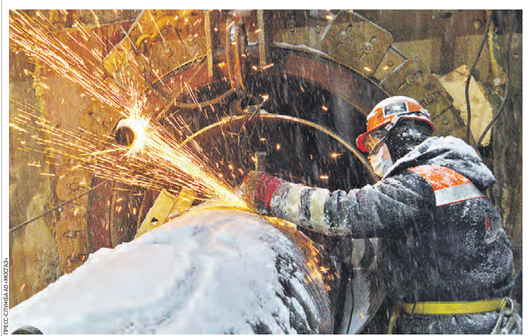
5 января 14:52 Специалист «Мосгаза» работает над реконструкцией дюкера «Кутузовский», который считается одним из самых сложных газопроводов столицы

Специалисты «Мосгаза» ведут реконструкцию двух дюкеров — подводных газопроводов «Кутузовский» и «Фрунзенский». Сложнейшие работы проводят так, чтобы минимизировать дискомфорт для жителей. Подробности вчера выяснила «ВМ».