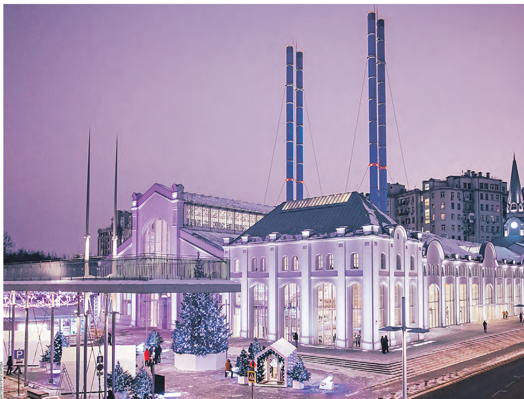
1 декабря 2021 года. Вид на Дом культуры «ГЭС-2», который создали в выведенной из эксплуатации «трамвайной», позже — «государственной» электростанции в Москве. Ранее это была одна из старейших электростанций столицы, а теперь — одна из самых знаковых культурных площадок

Стало традицией обсуждать в начале года проекты благоустройства, которые будут выполнены в летние месяцы. Что в планах на нынешний год?