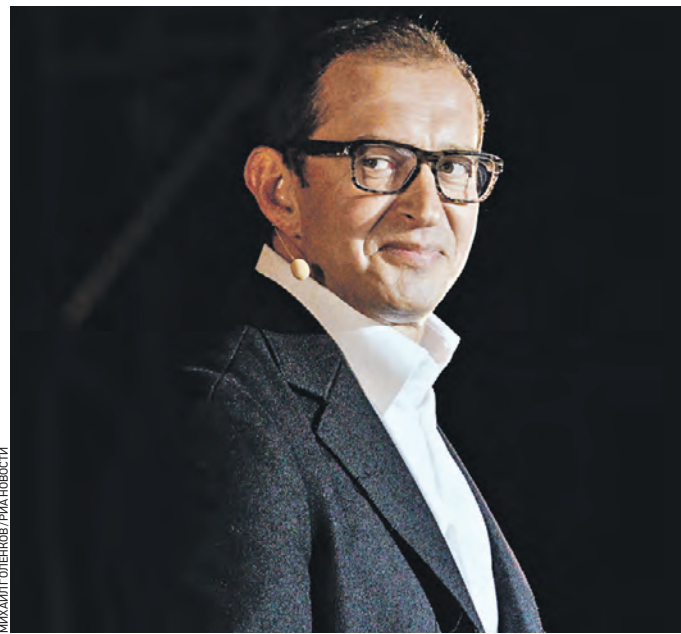
27 августа 2021 года актер Константин Хабенский играет в спектакле по мотивам оперы Чайковского «Евгений Онегин»

Путь к театральным подмосткам был долгим. Чтобы сводить концы с концами, Хабенскому приходилось работать сторожем, уборщиком и дворником. Но судьба улыбнулась начинающему актеру: ему удалось устроиться монтажером декораций в театре-студии «Суббота». Там же он сыграл свои первые роли. В 1995 году Константин Хабенский окончил Санкт-Петербургскую государственную академию театрального искусства, а в 2003-м стал частью труппы МХТ имени Чехова, где работает по сей день, уже в качестве художественного руководителя. Всенародную известность Хабенскому принесла роль милиционера Игоря Плахова в сериале «Бойная сила». А дальше последовала работа в фильмах «Ночной дозор» и «Дневной дозор». В них Константин Хабенский перевоплотился в мага Антона Городецкого, защищающего Москву от темных сил. — Константин блестяще работал в этом фильме. Сложно кого-то другого представить в этой роли. На съемках он даже мне жизнь спас, — рассказала актриса Мария Порошина. — Мы работали в вагоне метро. В сцене было задействовано много людей. Все толкались. И вдруг я случайно оступилась, чуть не упала между поездом и перроном. Но Константин вовремя меня подхватил. Так что он мой герой. Желаю ему всего самого доброго, светлого. В 2018 году Константин Хабенский впервые выступил