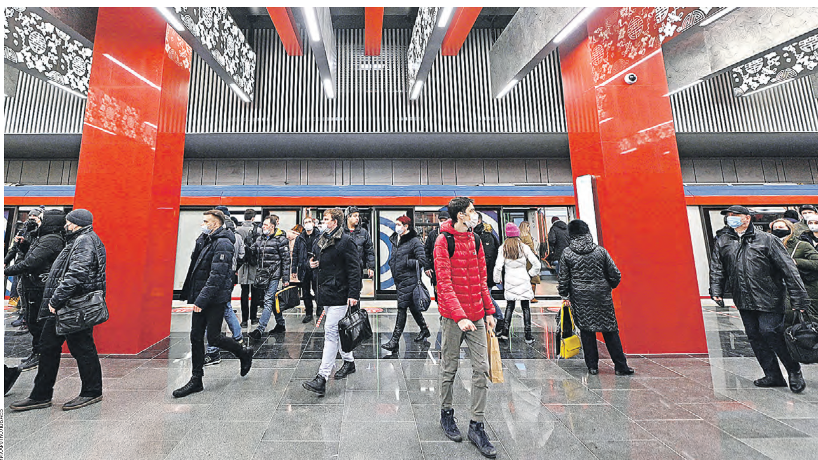
7 декабря 2021 года. Пассажиры на станции «Мичуринский проспект» Большой кольцевой линии метрополитена

Сергей Собянин: Мы не планируем рекорды и не стремимся рисовать красивые цифры. Просто системно работаем над каждым проектом