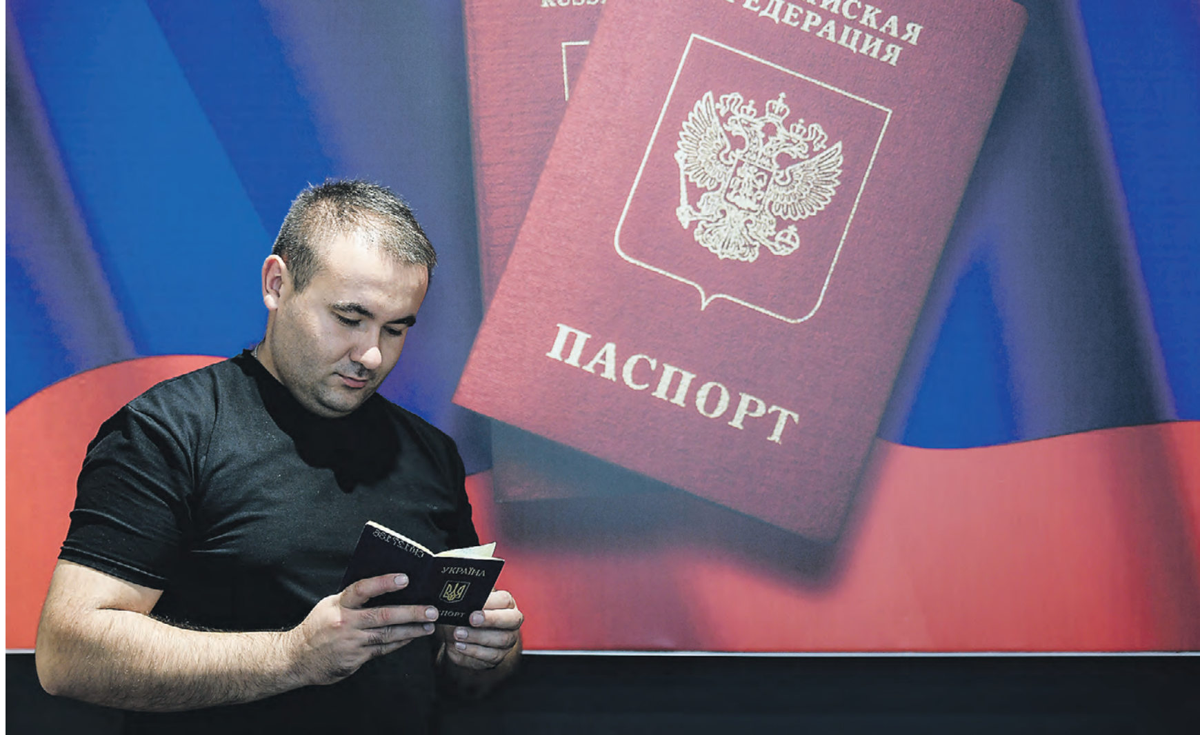
30 июля 2022 года. Житель Бердянска пришел в пункт приема документов на гражданство России, чтобы заменить свой старый украинский паспорт на новый российский и стать частью нашей большой страны