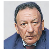
АРКАДИЙ ЗЛОЧЕВСКИЙ ПРЕЗИДЕНТ РОССИЙСКОГО ЗЕРНОВОГО СОЮЗА

Тем не менее, несмотря на существующие проблемы, уборка урожая в России идет полным ходом. Наша пшеница слывет на весь мир. Она объективно намного лучше по качеству, чем французская или немецкая, например. Так что на наш продукт определенно будет спрос на мировом рынке.