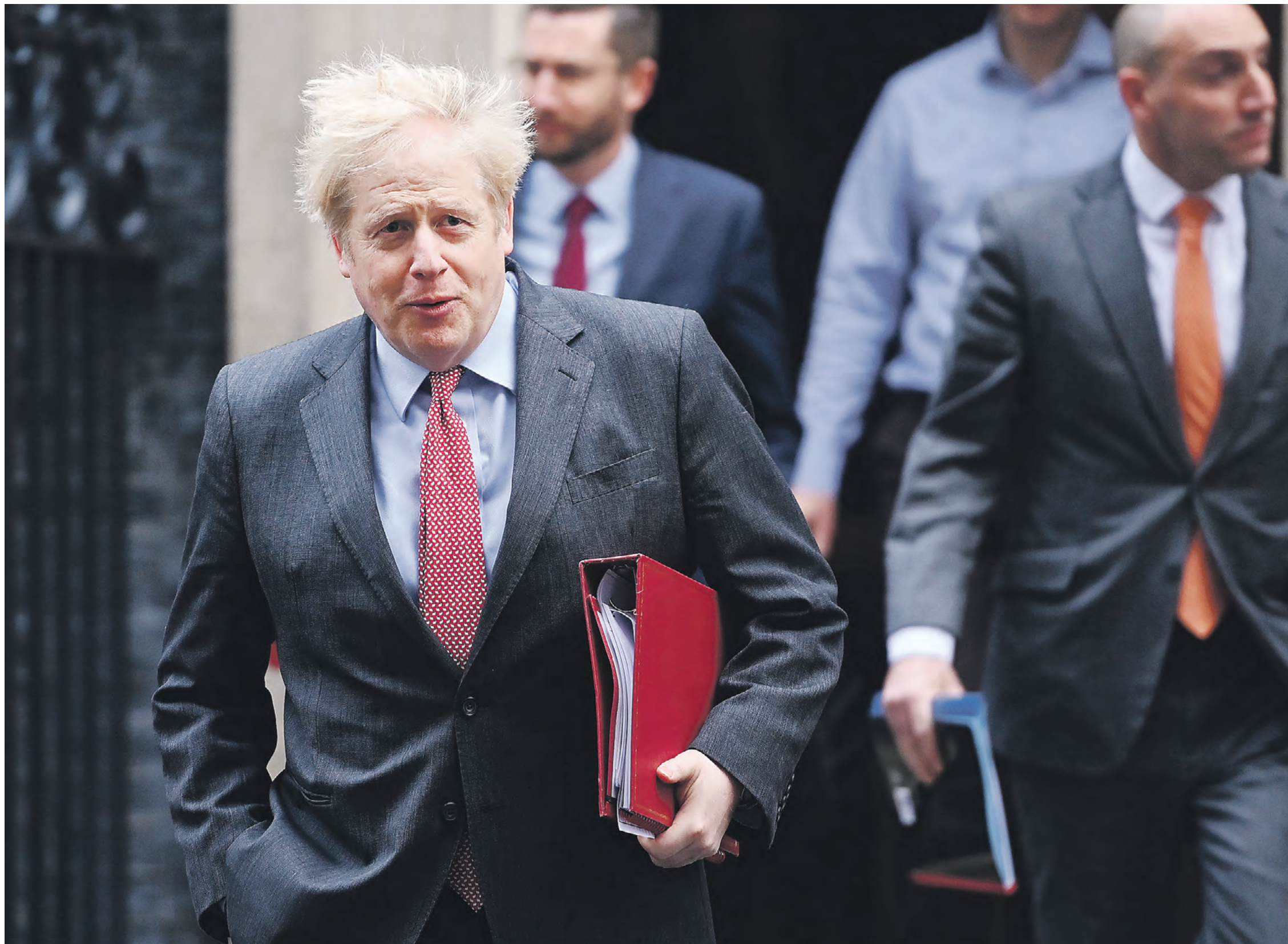
8 декабря 2020 года. Премьер Великобритании Борис Джонсон проводит совещание с министрами перед поездкой в Брюссель на переговоры по брекзиту (выходу Соединенного королевства из Европейского союза)

Процветавшие предприятия континента готовятся к банкротству