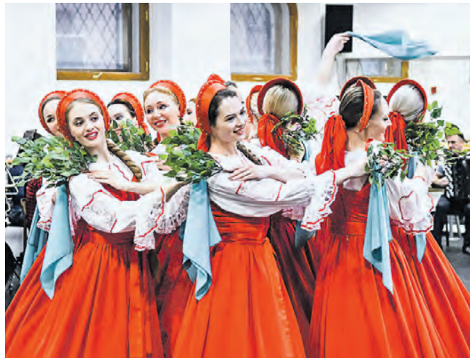
8 декабря 15:28 Танцовщицы знаменитого ансамбля «Березка» кружатся в традиционном хороводе

В здании, расположенном по адресу: Леонтьевский переулок, 7, сейчас идут репетиции — здесь создается очередное русское хореографическое чудо. У балетных станков девушки и юноши разминаются, выполняя сложные упражнения, чтобы на сцене легко исполнять танцевальные па. А в соседней комнате разместились огромная костюмерная с яркими разноцветными платяными и сарафанами, украшенными вышивкой, кружевом, бисером и жемчугом.