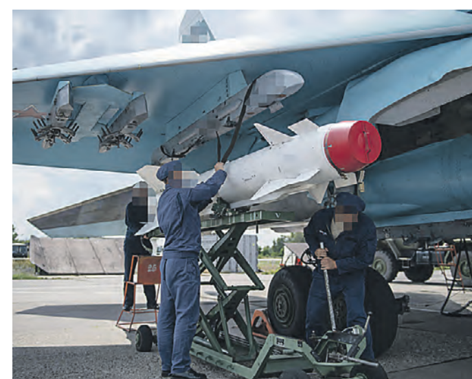
16 июля 2022 года. Предполетная подготовка истребителя-бомбардировщика Су-34 ВКС РФ на аэродроме в зоне СВО

Новая партия боевых самолетов Су-34 передана в ноябре 2022 года оборонно-промышленным комплексом Воздушно-космическим силам России. Изготовленные на Новосибирском авиационном заводе имени В. П. Чкалова Объединенной авиационно-строительной корпорации многофункциональные воздушные машины прошли полный комплекс наземных и летных испытаний и уже совершили перелет к месту несения службы.