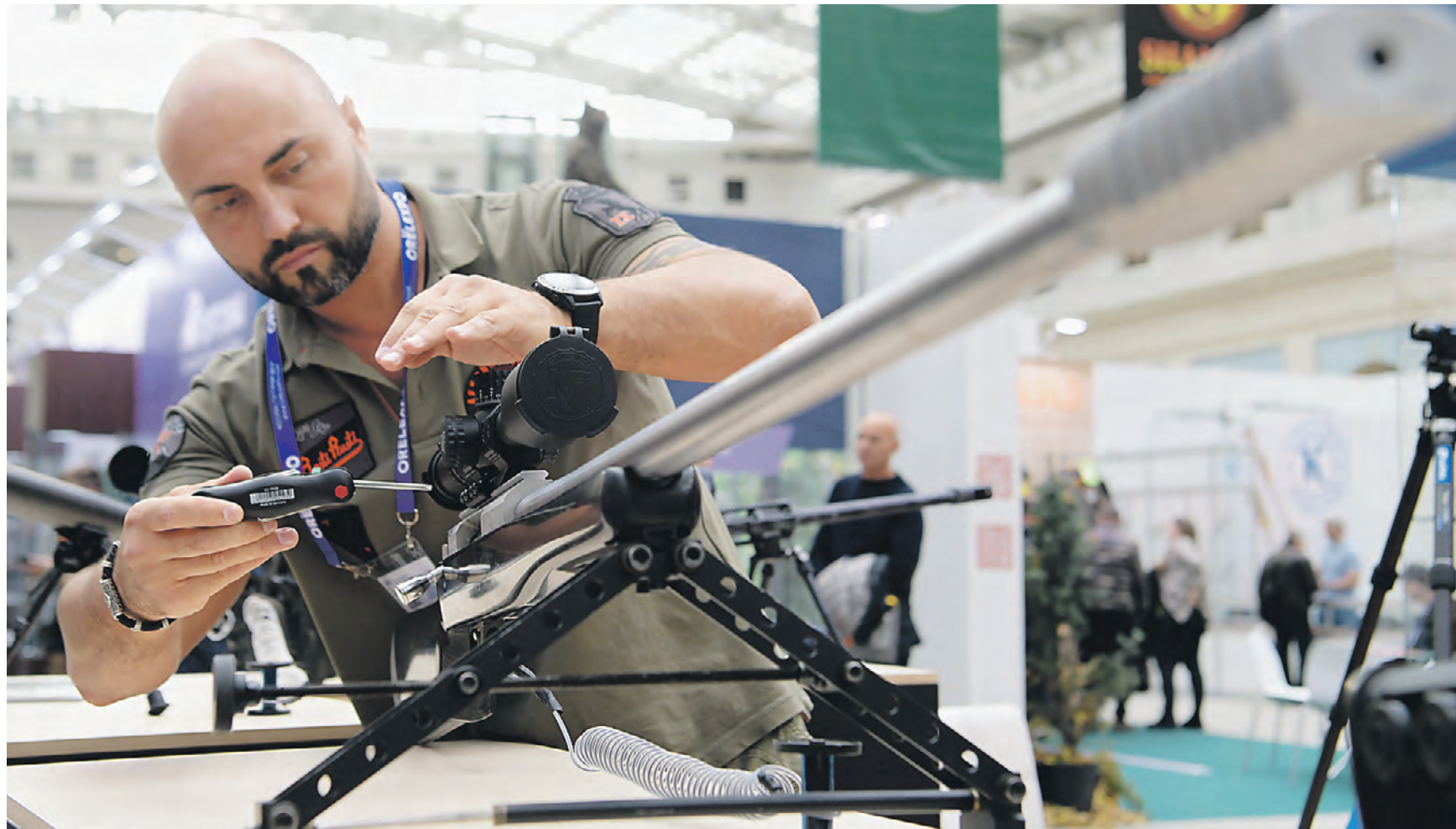
13 октября 2022 года. Москва. На Международной выставке оружия и товаров для охоты в Гостином Дворе один из ее участников настраивает прицел сверхдальнобойной винтовки SVLK-145 «Сумрак»

За выполнение особо важных задач в ходе специальной военной операции на Украине 14 октября 2022 года один из российских снайперов был удостоен высокого звания Героя Российской Федерации. Десятки целей военнотехнической ликвидировал из дальнобойной винтовки «Сумрак». Это командный состав противника, наводчики артиллерийского огня, корректировщики авиационных ударов, пулеметчики, гранатометчики, операторы противотанковых ракетных комплексов. Но в ходе специальной военной операции российские снайперы оказались в принципиально новых боевых условиях. Потребовалось уничтожать малогабаритные цели, находящиеся в хорошо защищенных укрытиях и бетонированных сооружениях. Городские бои в Мариуполе и взламывание линии готовившихся в течение восьми лет оборонительных сооружений вооруженных сил Украины (ВСУ) под Донецком показали, что давно идущие разговоры об уходе с армейской службы на «пенсию» СВД (снайперская винтовка Драгунова) пора прекратить. Закончилось ее