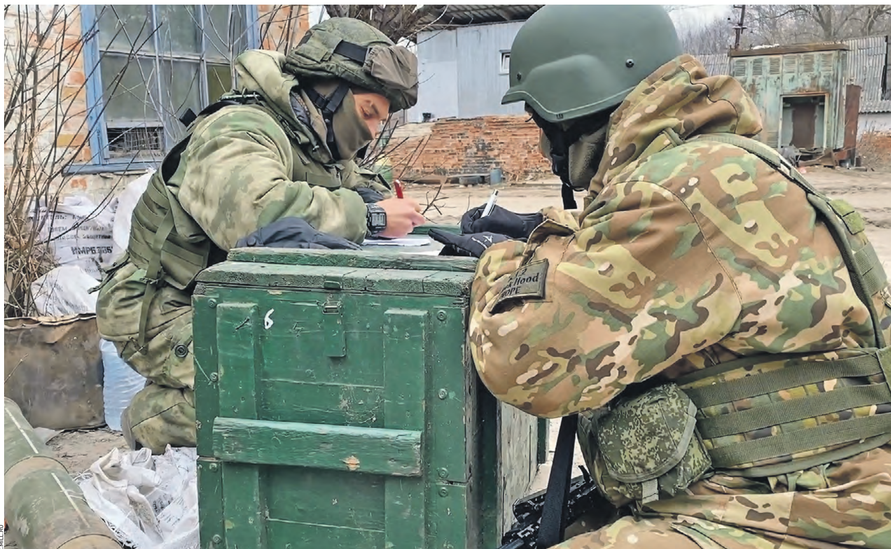
Вчера 09:00 бойцы Вооруженных сил России пишут письма родным. Для того чтобы весточки с фронта доходили до адресатов, Минобороны РФ организовало работу по доставке почтовых отправлений военнослужащим, участвующим в СВО

— Перехвачены две украинские баллистические ракеты «Точка-У» и два реактивных снаряда системы залпового огня HIMARS в районе населенного пункта Юбилейное Херсонской области. Также уничтожено шесть беспилотных летательных аппаратов в районах населенных пунк-