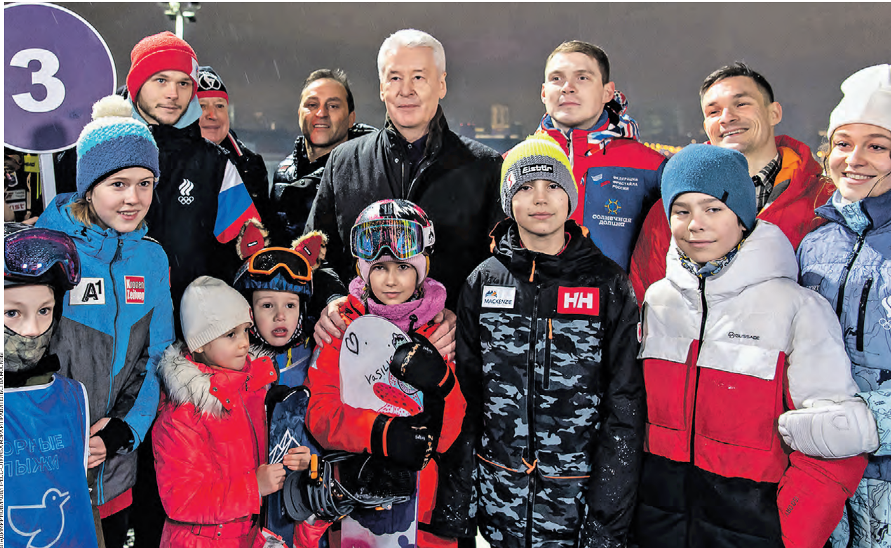
23 декабря 19:47 Мэр Москвы Сергей Собянин (в центре) на открытии кластера зимних видов спорта на Воробьевых горах пообщался со спортсменами и поздравил их с возрождением главного горнолыжного центра столицы