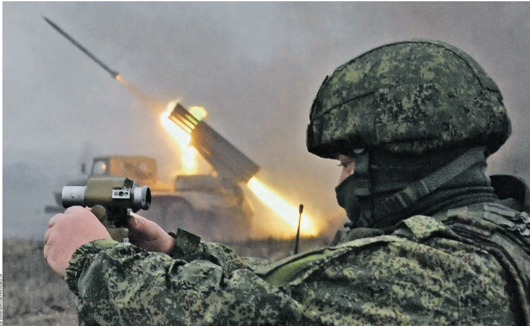
21 декабря 10:53 Российский военнослужащий производит наведение реактивной системы залпового огня БМ-21 «Град» на Запорожском направлении. Наши солдаты успешно пресекают все контратаки противника