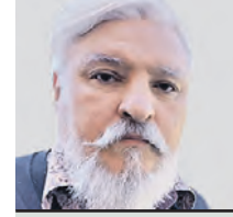
ИГОРЬ БУХАРОВ ПРЕЗИДЕНТ ФЕДЕРАЦИИ РЕСТОРАТОРОВ И ОТЕЛЕЙЕРОВ

А вот с уходом западных брендов ниша отечественного фастфуда чувствует себя прекрасно при любом кризисе. Ранее я говорил, что к осени все наладится, так и произошло. Логистика восстановилась, рестораторы переработали меню и пересмотрели кадровый состав. Да, некоторые западные коллеги уехали из России. Но они предлагают нашим партнерам из дружественных стран вести совместный бизнес.