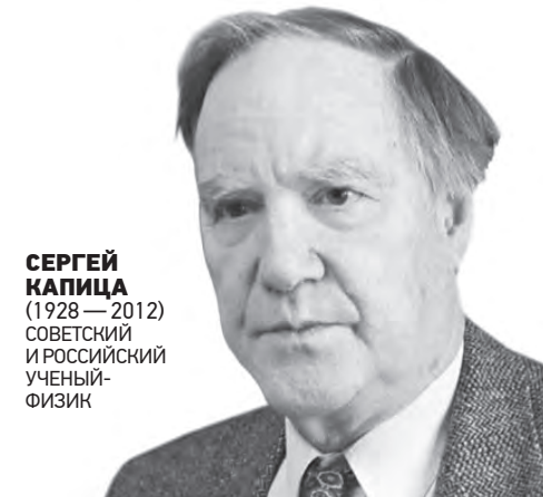
СЕРГЕЙ КАПИЦА (1928—2012) СОВЕТСКИЙ И РОССИЙСКИЙ УЧЕНЫЙ-ФИЗИК

Телевидение, это сильнейшее средство взаимодействия людей, сейчас находится в руках тех, кто совершенно безответственно относится к своей роли в обществе.