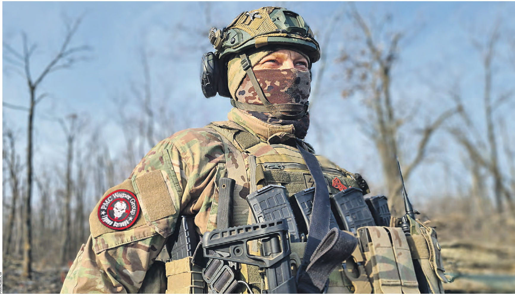
17 января 13:44 Боец группы «Вагнер» в Артемовске в ДНР. На сегодняшний день взятие этого города остается приоритетной задачей для России. Чтобы полностью замкнуть кольцо вокруг населенного пункта, военным не хватает всего 10 километров