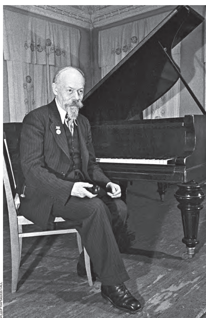
6 сентября 1947 года. Заведующий кафедрой композиции Государственного музыкально-педагогического института композитор Михаил Фабианович Гнесин