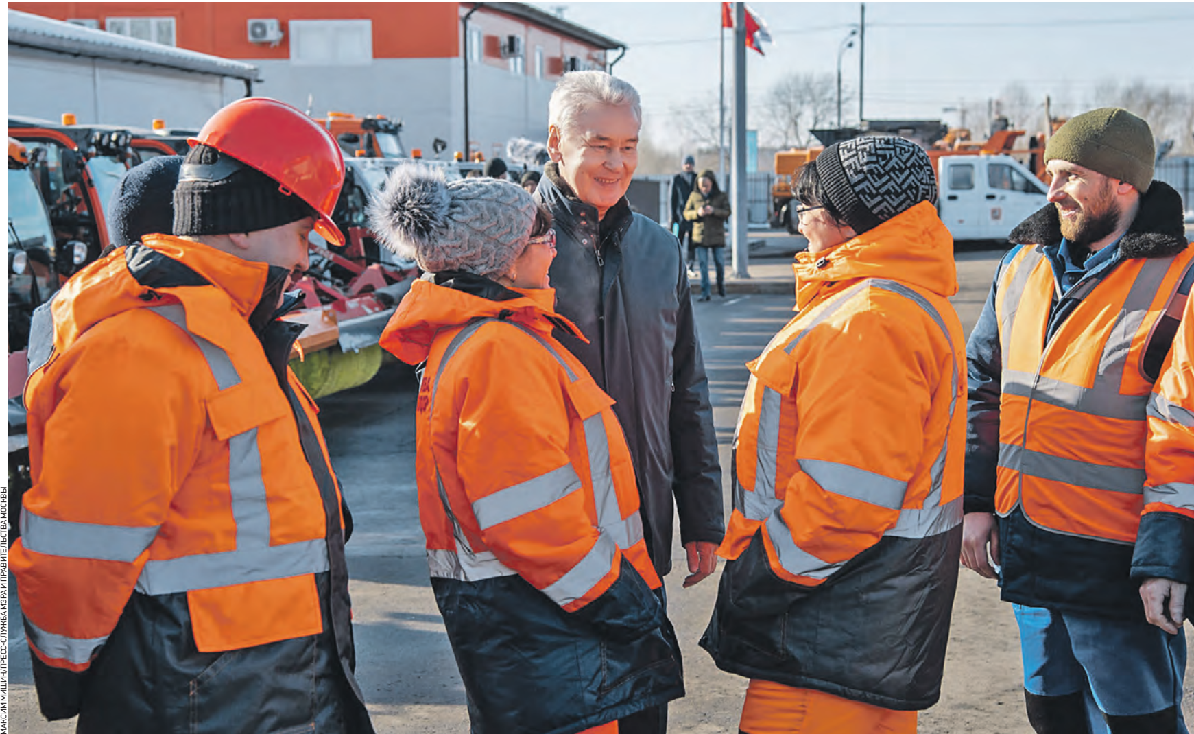
15 февраля 2022 года. Мэр Москвы Сергей Собянин (в центре) осмотрел производственный комплекс «Очаково» ГБУ «Автомобильные дороги». Теперь в этом столичном районе построят новые объекты, взяв в оборот один из участков местной промзоны. Власти уже приняли соответствующее решение

— В ходе реорганизации территории планируется разместить современные высокотехнологичные производства, создать офисы, банки, магазины, организовать свыше 2,1 тысячи рабочих мест, — заявил Сергей Собянин. Мэр пояснил, что в столице ведется активная работа по 25 проектам комплексного развития территорий общей площадью более 366 гектаров. Объем инвестиций в них составит около 705 миллиардов рублей. На этих территориях намечено построить промышленные предприятия и технопарки общей площадью 1,8 миллиона квадратных метров. Это даст городу 87 тысячи рабочих мест.