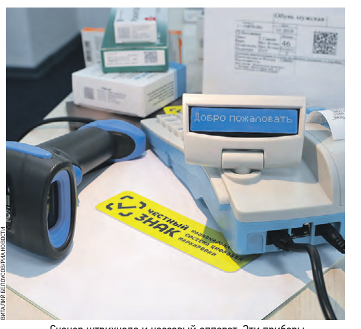
Сканер штрихкода и кассовый аппарат. Эти приборы позволяют выявить контрабанду