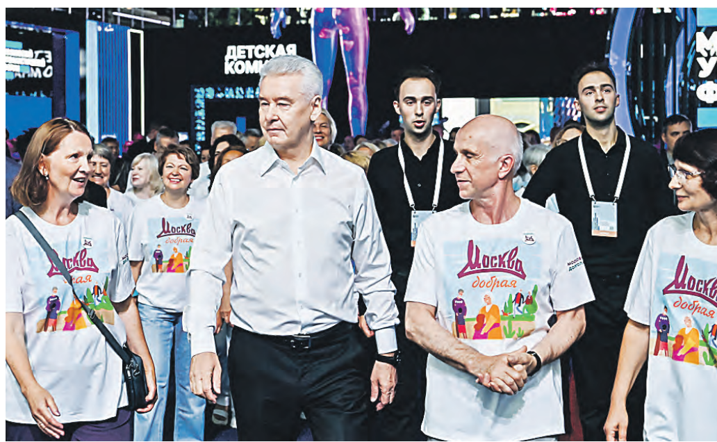
14 августа. Мэр столицы Сергей Собянин (в центре) на встрече с участниками проекта «Московское долголетие», прошедшей в рамках Урбанфорума в Гостином Дворе

ский государственный естественно-промышленный университет имени Строганова, Московский Политех. Расширили программу для тех, кто интересуется историей. В проекте открыто свыше 200 групп по истории страны, искусств, кинематографа и краеведению, — заявил мэр Москвы. Сергей Собянин отметил, что много интересного найдут для себя любители спорта. — На выбор 50 видов активностей — от гимнастики до футбола. И, конечно, по традиции зимой в столичных парках стартуют занятия по катанию на коньках и лыжах, — добавил он. Напомним, в настоящее время для участников «Московского долголетия» открыто около пяти тысяч групп. Кроме этого работают более сотни групп в столичных поликлиниках по спецпрограмме «Тренировки долголетия». А вот занятия в парках в зимнее время пройдут при хорошей погоде.