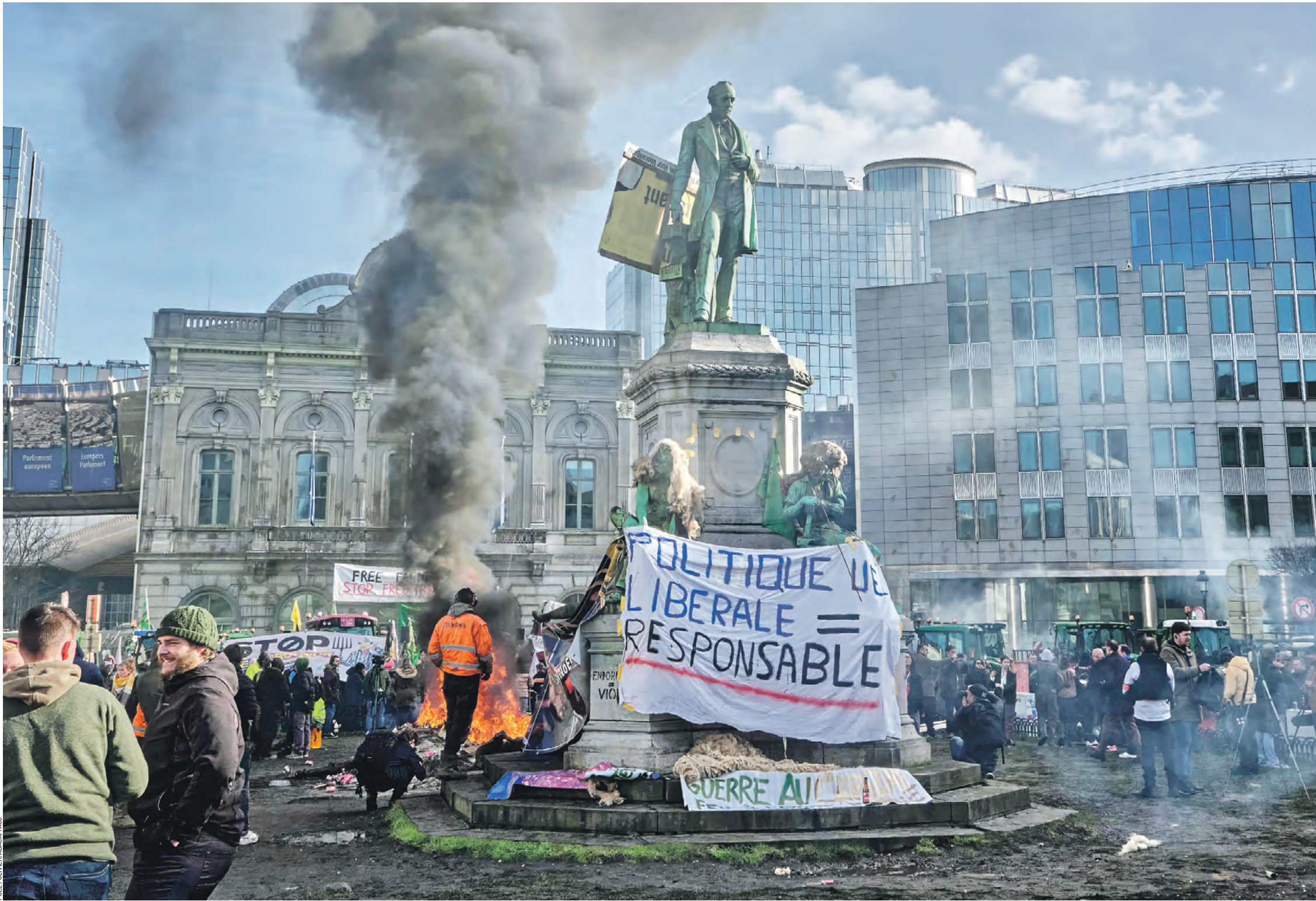
1 февраля. Брюссель. Акция протеста, организованная несколькими сельскохозяйственными профсоюзами Бельгии и других стран. Подобные акции протеста фермеров охватили сейчас всю Европу

В Европе — бунт. В начале февраля фермеры прокатились на грузовиках по Брюсселю, где лидеры стран ЕС проводили саммит по Украине. Аграрии разбили лагерь у здания парламента, бросали в его окна яйца, трубили в рога и разжигали костры. В Германии крупные дорожные заторы охватили города с востока на запад, включая Гамбург, Кельн, Бремен, Нюрнберг и Мюнхен: на каждую акцию протеста было зарегистрировано до двух тысяч тракторов. Во Франции фермеры перекрыли основные автомагистрали, ведущие в Париж, а также в города Лион и Тулузу. Десятки фермеров установили палатки и разожгли костры, чтобы согреться, пытаясь перекрыть маршруты, ведущие во французскую столицу. В окна мэрий некоторых городов протестующие швыряют навоз. Агентство Reuters приводит слова французского Жана-Мари Дира: