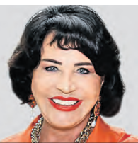
НАДЕЖДА БАБКИНА ХУДРУК МОСКОВСКОГО ГОСУДАРСТВЕННОГО АКАДЕМИЧЕСКОГО ТЕАТРА «РУССКАЯ ПЕСНЯ»

Тур с концертно-драматической программой пройдет в восьми городах и четырех регионах. Первый город, который сможет увидеть мистерия, — Курск. Даты мероприятия там 22–23 февраля. Второй — Сочи. Там концерт пройдет во время фестиваля молодежи с 5 по 7 марта. Третий город — Крым. А в период «Крымской весны» мистерия окажется в Симферополе, Керчи, Краснопереконске, Красногвардейске и Саки — с 8 по 13 марта. Последний город — Воронеж. Там программу покажем 11–12 мая.