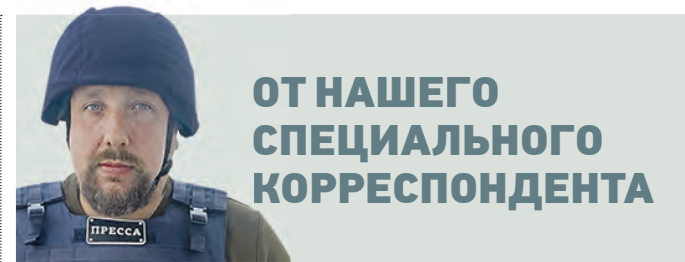
ОТ НАШЕГО СПЕЦИАЛЬНОГО КОРРЕСПОНДЕНТА

Драматург, который не любил картинных положительных героев, но заслужил признание миллионов зрителей → стр. 7