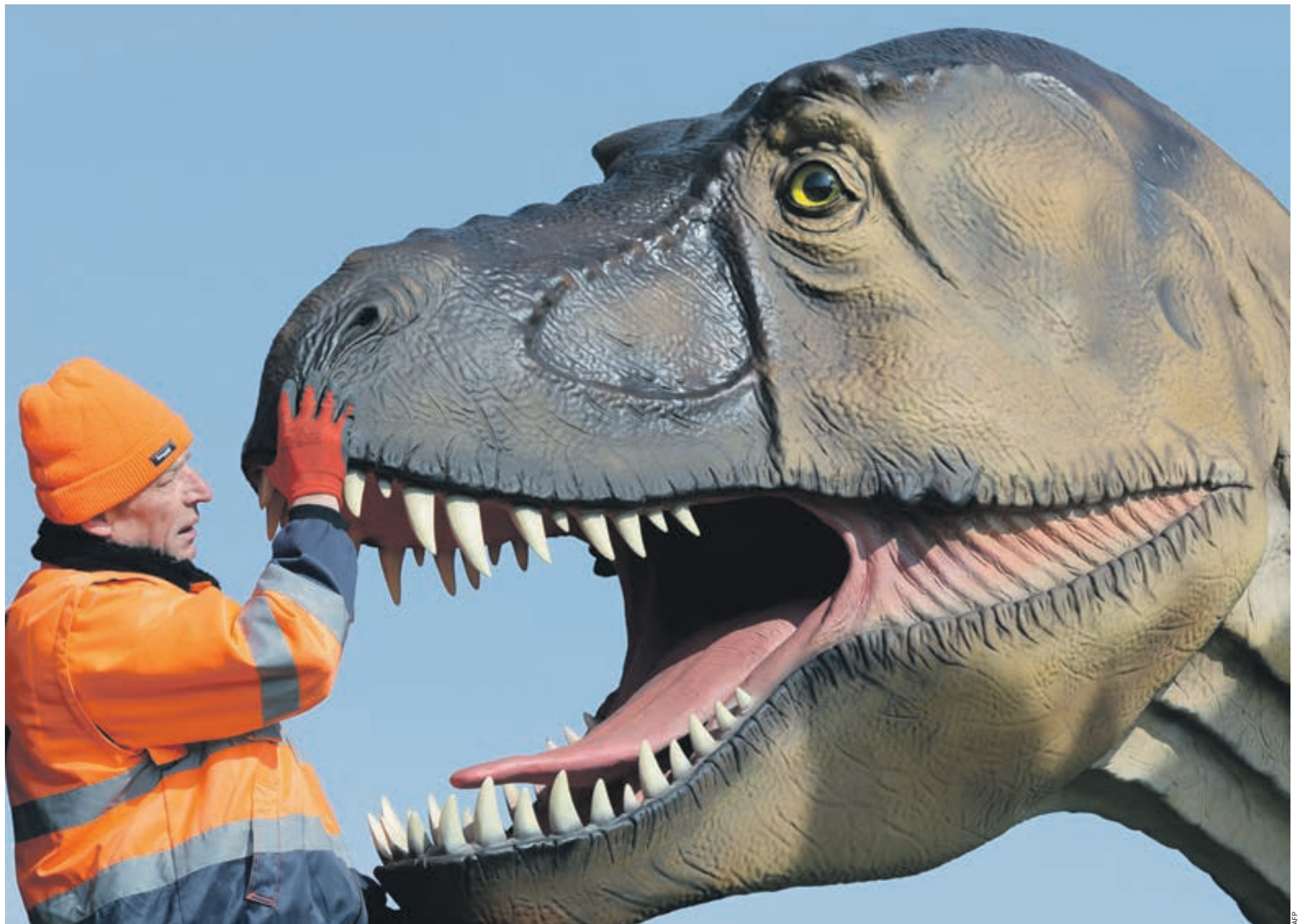
ТОЧКА Сегодня точку в номере ставит работник парка развлечений в немецкой коммуне Вустермарк и его ручной пятнадцатиметровый тираннозавр. А также 39 других хищных и травоядных доисторических рептилий, из-за своих габаритов не попавших в кадр. Местные фанаты динозавров решили устроить собственный ремейк «Парка Юрского периода» и подготовили внушительную экспозицию скульптур зубастых и хвостатых красавцев. Получилось, как в знаменитом фильме — правдоподобно, зрелищно и жутковато.

ров, убийц, насильников и мафиози лабают столько, что пленкой можно выстлать дорогу если не в ад, то уж точно в места самые что ни на есть отдаленные. Только «Калина красная» — совсем про другое, про спасение грешника, про выздоровление больной души, про то, что возможность начать все сначала есть всегда, и даже у изгоев общества. Говорят, в кино каждый должен заниматься своим делом. Мол, сценарное мастерство, режиссура, актерство — совсем разные профессии, и каждой надо долго учиться, поэтому лезть на съемочной площадке в чужую епархию — значит, портить картину. Шукшин блестяще опроверг это расхожее утверждение. В каждой своей ипостаси он был талантливым, глубок и разносторонен, как человек Ренессанса. Мужик мужиком в кадре, удивительно точное соотношение нежности, жестокости и юмора в рассказанной истории, сцены ошеломительной силы (вспомните хотя бы поездку Егора Прокудина к бабке Куделихе — матери, брошенной им двадцать лет назад. Ее, кстати, сыграла не профессиональная актриса, а женщина из деревни, где проходили съемки). И все это один человек, который, конечно, научился кое-чему в Институте кинематографии, но самородный талант которого был виден везде, озаряя все, к чему бы Шукшин ни прикасался.