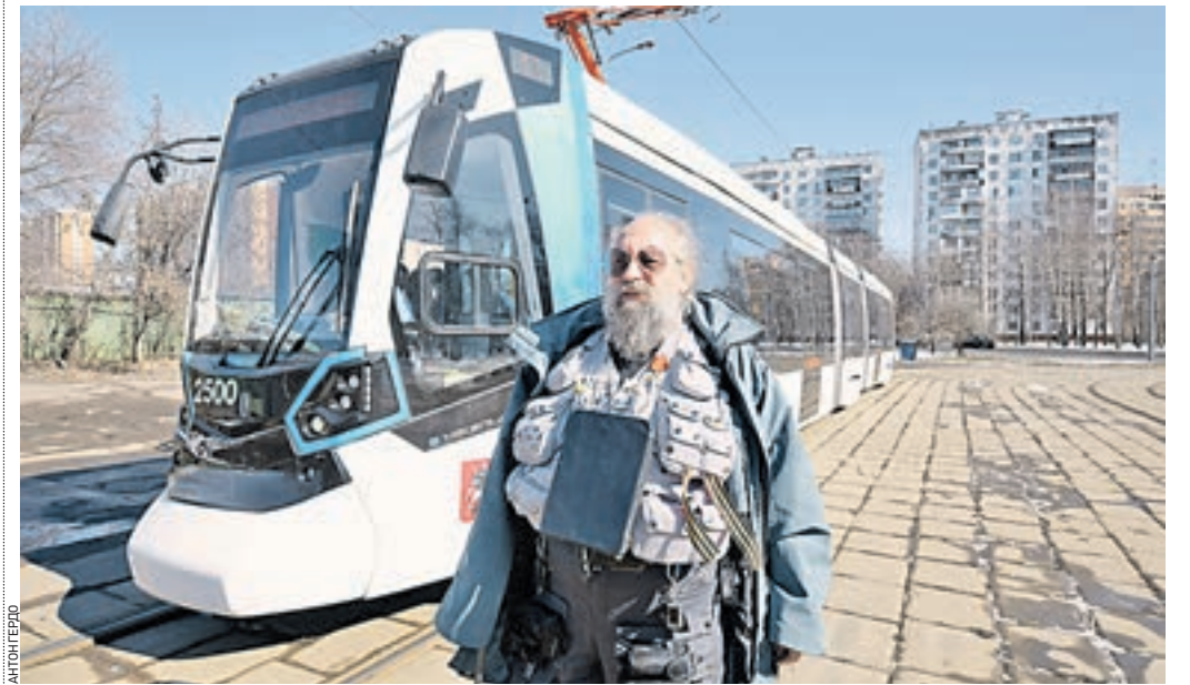
23 марта 13:10 Анатолий Вассерман прокатился на новом трамвае «Метелица» и оценил, насколько комфортно может быть поездка на общественном транспорте

Трамвай «Метелица» разрабатывался в Белоруссии специально для России и стран СНГ. Общая вместимость — от 180 до 250 пассажиров, максимальная скорость — 75 километров в час.