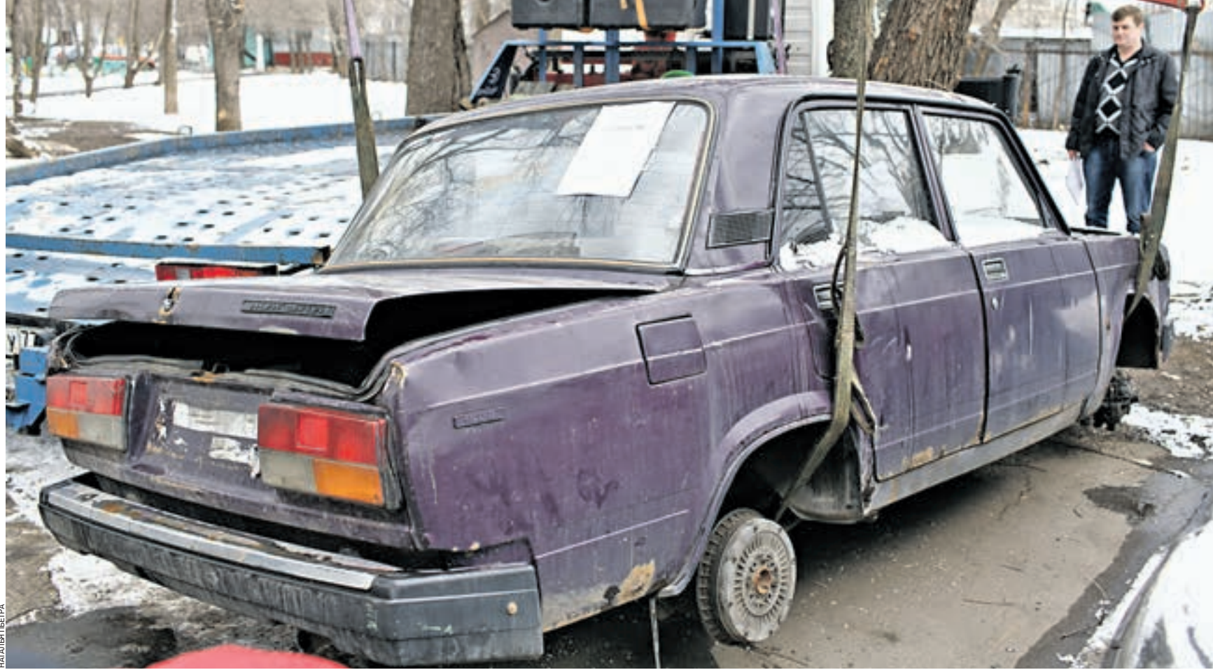
Вчера 10:05 Брошенные «жигули» у дома № 12 по улице Бестужевых грузят на платформу эвакуатора. Машину отвезут на спецстоянку, где она будет ждать хозяина три месяца

ПОРЯДОК Вчера на северо-востоке столицы местные коммунальные службы эвакуировали брошенный автомобиль. В операции принял участие и корреспондент «ВМ». Очистка дворов от автохлама по новым правилам началась полгода назад.