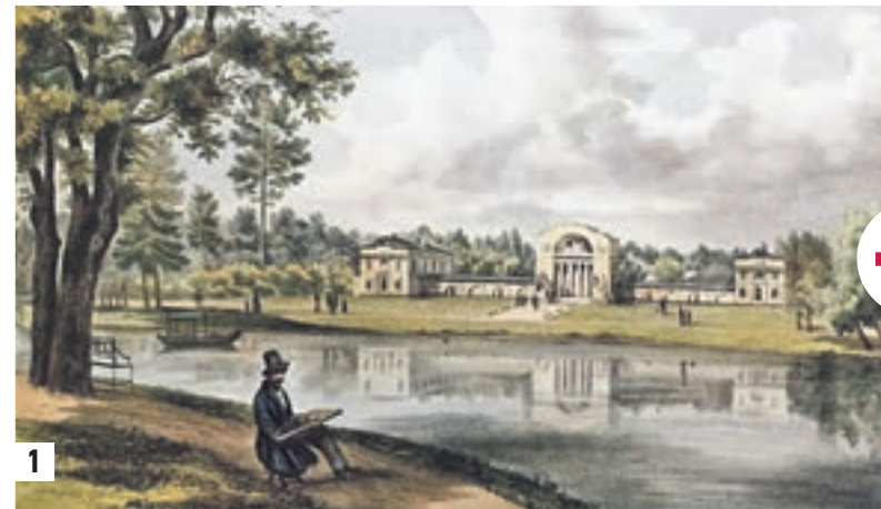
1841 год Гравюра австрийского художника Иоганна-Непомука Рауха «Вид подмосковной усадьбы Кузьминки. Конный двор». Работа хранится в Музее Василия Тропинина (1) 19 марта 2015 года 16:53 Молодая пара на мосту с видом на Конный двор. Архитектурный ансамбль, вдохновлявший Рауха, бережно сохранили (2)