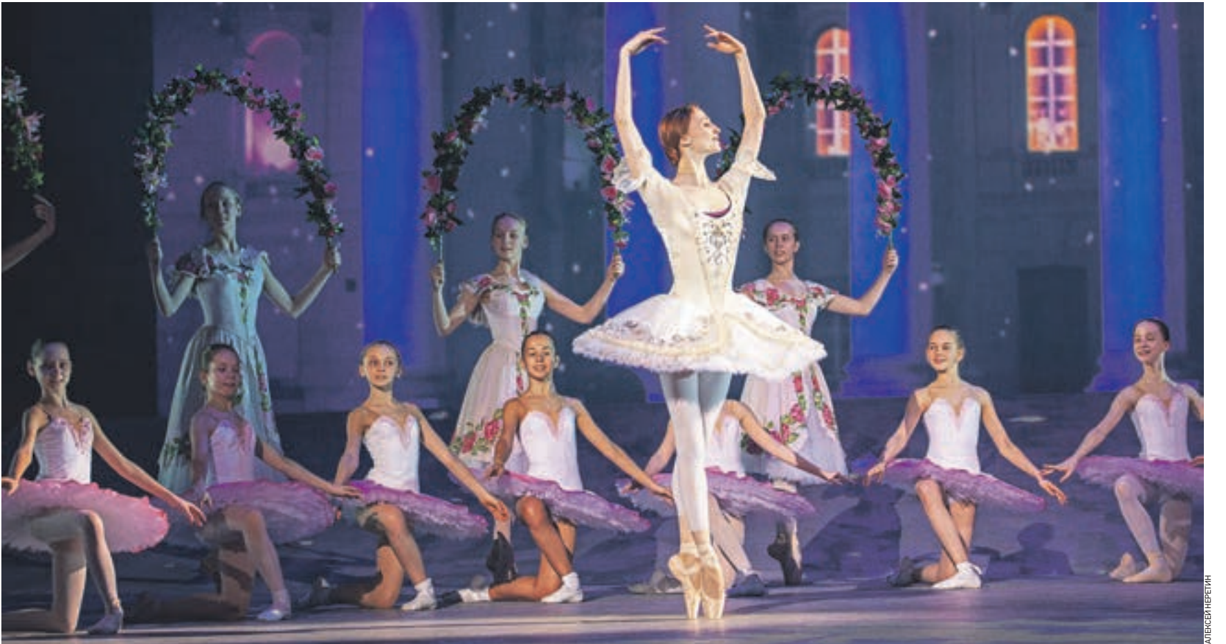
Вчера 13:27 В концертном зале «Россия» в Лужниках Светлана Захарова вместе с воспитанниками Красногорского хореографического училища исполнила адажио из балета «Щелкунчик»

Да. С воспитанниками Красногорского хореографического училища я танцевала адажио из балета «Щелкунчик» на музыку Чайковского. К нам присоединился мой партнер — солист Большого театра Руслан Скворцов.