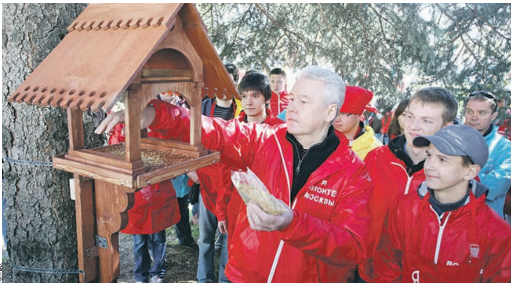
26 апреля 2014 года мэр Москвы Сергей Собянин и волонтеры приняли участие в субботнике на ВДНХ. В прошлом году территория Выставки достижений народного хозяйства и Ботанического сада стала единым парковым пространством.

Гостиницы получат льготы В ходе заседания президиума правительства Москвы обсуждалась еще одна важная мера,