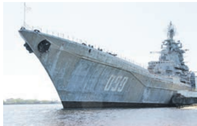
Атомный ракетный крейсер «Киров» имеет на вооружении практически все виды боевых средств, созданных для военных кораблей.

Календарь читала КСЕНИЯ ПЕТРОВА edit@vm.ru