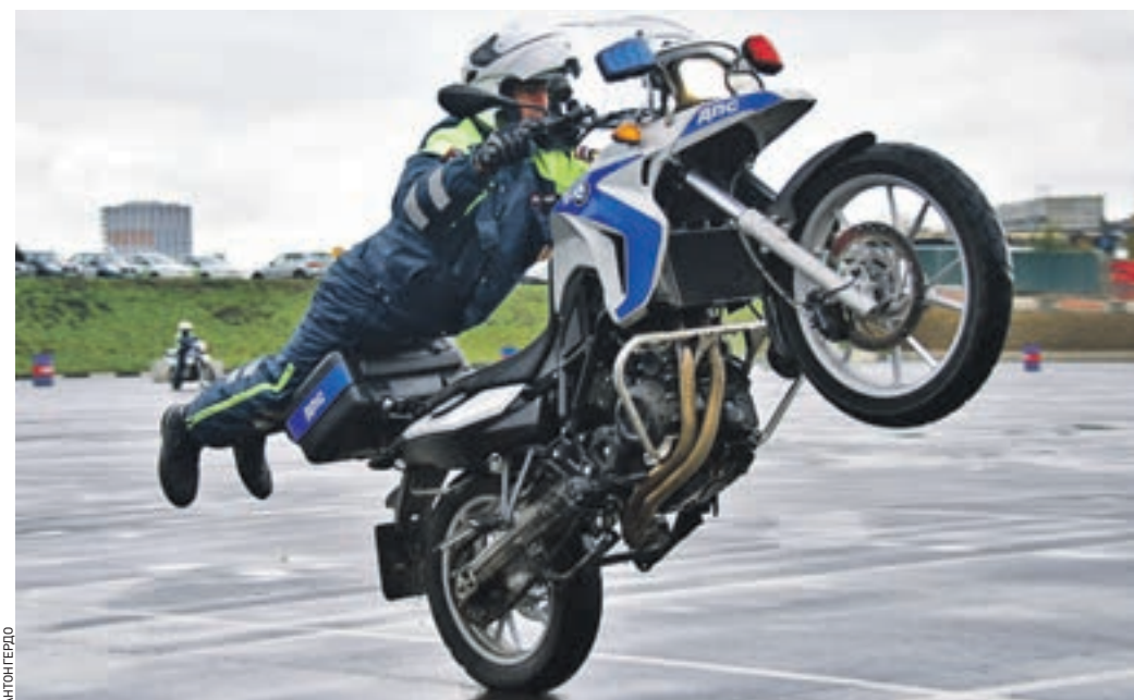
15 октября 14:39 Мотоциклист из пилотажной группы «Каскад» Управления ГИБДД города Москвы демонстрирует навыки экстремальной езды