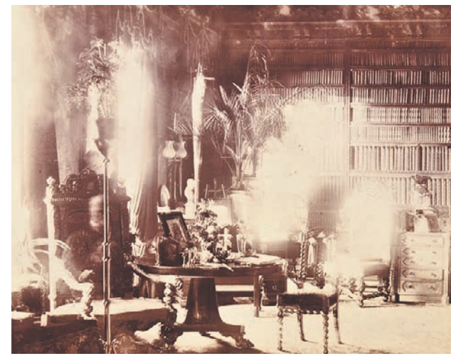
Призрак лорда Комбермера, попавший на пленку в библиотеке аббатства