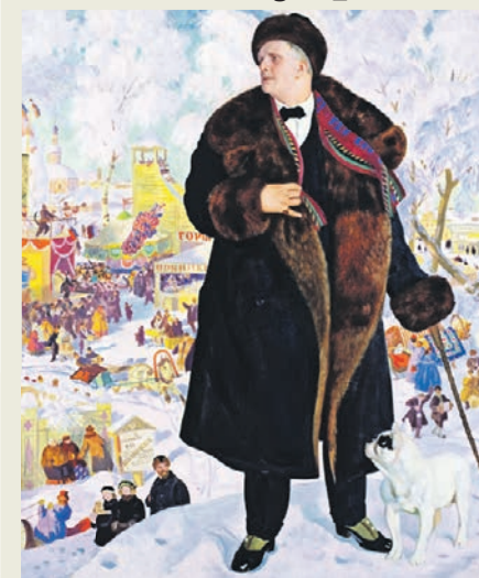
«Портрет Шаляпина», художник Борис Кустодиев, 1922 год

В дореволюционной России шубы в основном носили крытые сверху — простой тканью или сукном. Яркий образчик — шуба Федора Ивановича Шаляпина на портрете кисти Кустодиева. Оперный певец изображен в бобровой шапке и роскошной, богатой шубе, сшитой из бобрового меха, да вместе с воротником. Кстати, и профессор Преображенский из повести Михаила Булгакова «Собачье сердце» носил шубу мехом внутрь, но из чернобурки. У женщин был свой стиль — дамы солидного возраста предпочитали соболей, а девушки — сибирскую белку, каракуль, крота или зайчика, каким бы состоянием они ни обладали. В ношении мехов если и существовала иерархия, то не классовая, а возрастная.