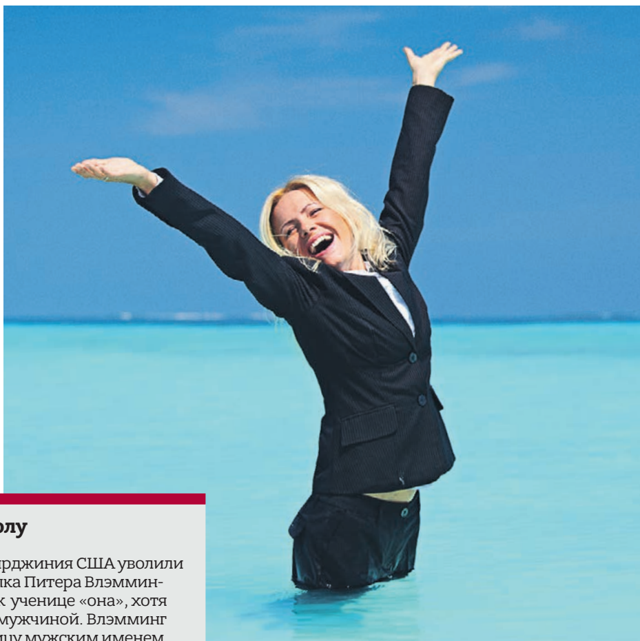
На этот раз акция «учителятожелюди» в поддержку преподавателя, уволенного из-за публикаций в социальных сетях, не повторилась