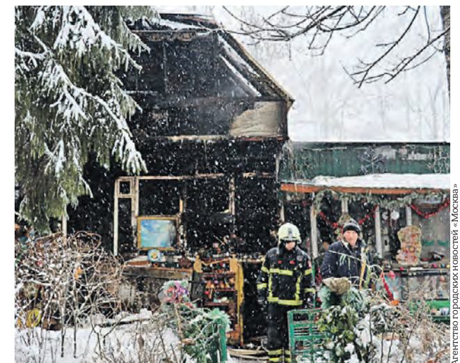
18 января 2022 года. Ликвидация пожара в голубятне на Сумской улице в столичном районе Чертаново Северное