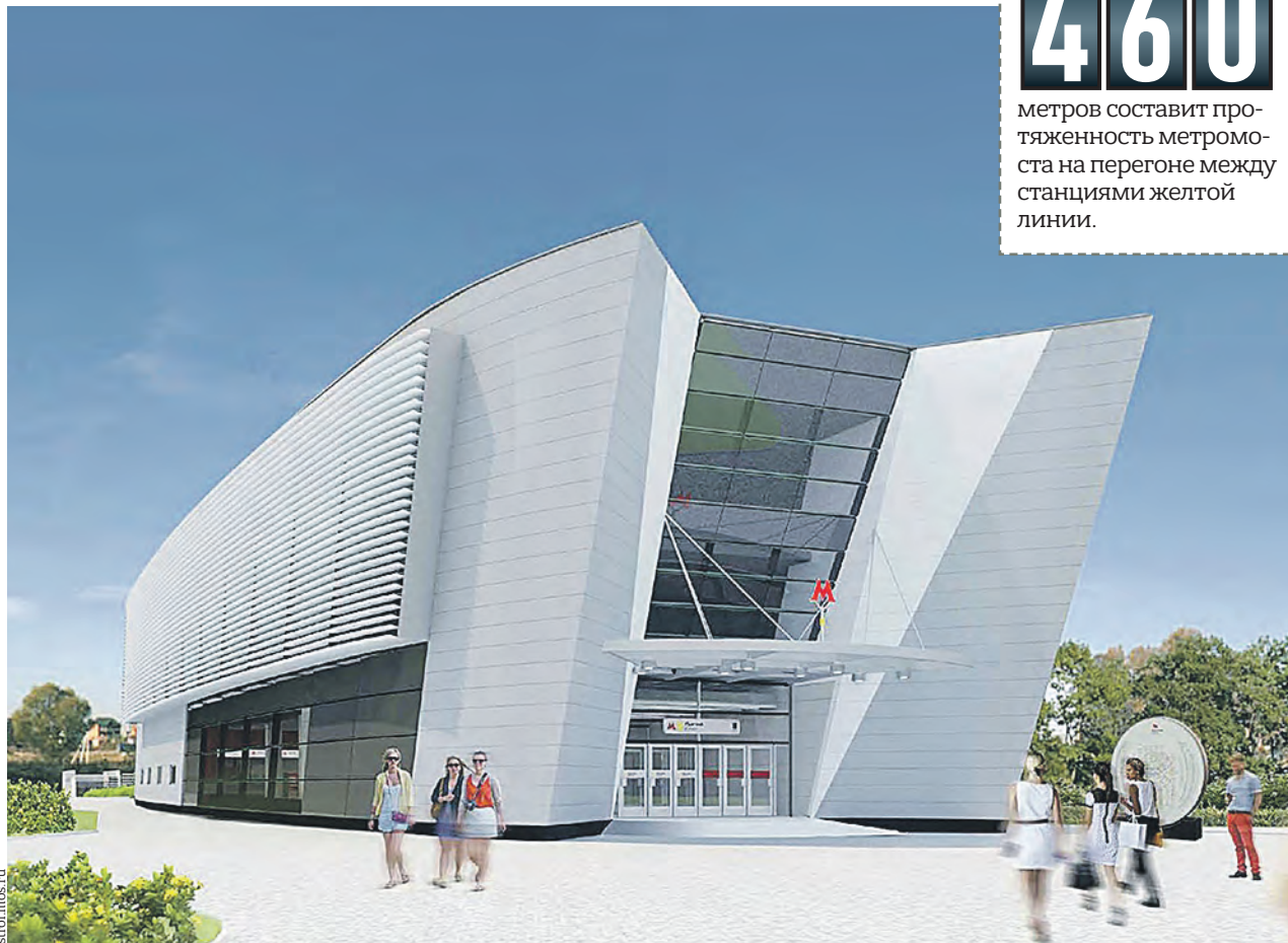
Проект будущей станции «Пыхтино» Солнцевской линии Московского метрополитена

томобильного тоннеля под дорожным полотном Центральной улицы Внукова