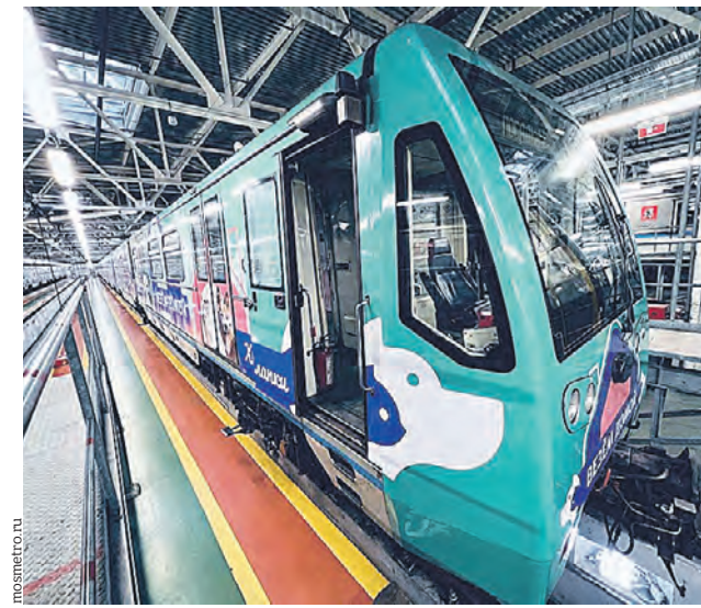
Обновленный поезд «Хвосты и лапки», посвященный сервису для поиска хозяев бездомным животным