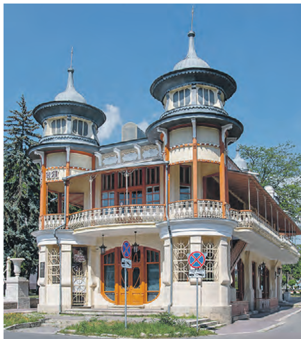
Памятник истории и архитектуры начала XX века, бывший дом-кафе Гукасова в Пятигорске