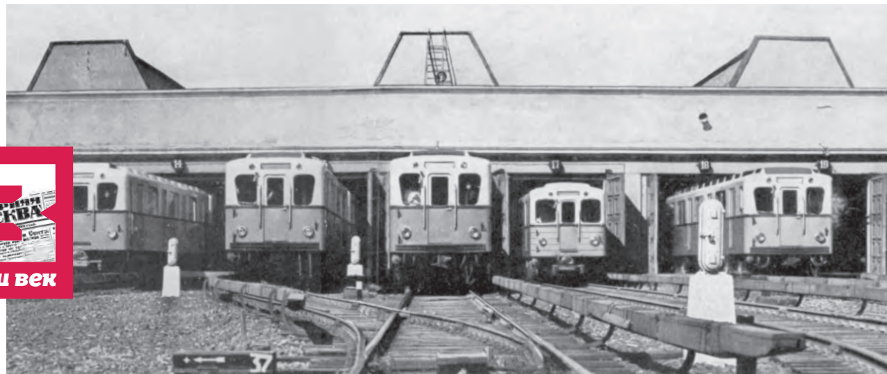
1960 год. Поезда в электродепо «Сокол» Московского метрополитена. В те годы одной из основных задач в рамках работы подземки было снизить уровень шума в тоннелях