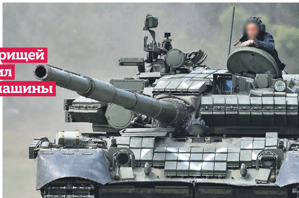
18 июня 2022 года. Российский военнослужащий проверяет функциональность танка Т-80, после того как его отремонтировали в зоне спецоперации