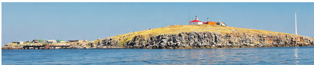
24 февраля на острове Змеиный в Черном море сдались в плен 82 украинских военнослужащих

— В воздушном налете было задействовано более 15 беспилотников, наведение которых осуществлялось двумя беспилотными летательными аппаратами Bayraktar TB2, — рассказал Конашенков. Он также сообщил, что в воздушном пространстве в районе острова Змеиный был замечен разведывательный беспилотник ВВС США RQ-4 Global Hawk. Удары по острову Змеиный нанесли баллистическими ракетами «Точка-У», РСЗО