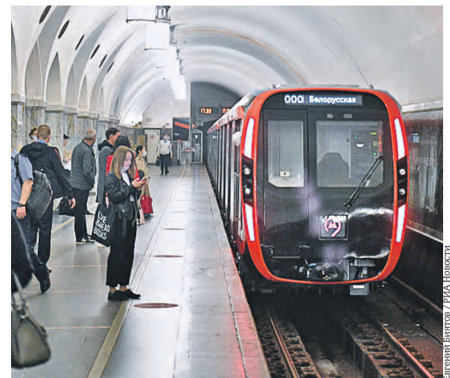
Поезд нового поколения «Москва-2020» на станции «Парк культуры» Кольцевой линии подземки