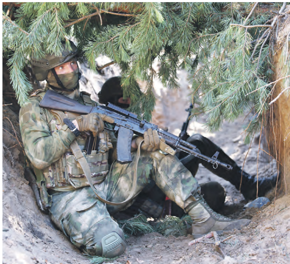
Военнослужащие Центрального военного округа во время подготовки в зоне специальной военной операции

— Смотрю новости, конца и края нет этому распространению нацизма и русофобии по всей планете. Американцы из кожи лезут, чтобы разделить, распилить нашу страну. Выкачать все ресурсы, рассорить все славянские народы — вот цель