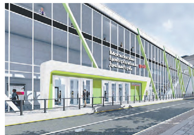
Проект благоустройства возле станции «Окружная» первого Московского центрального диаметра