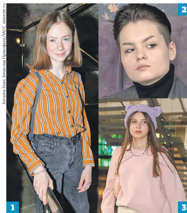
Persona Stars.