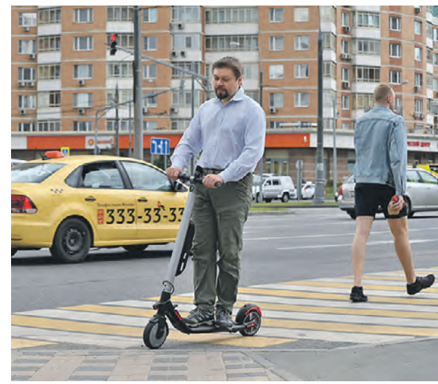
Житель столицы, позабыв о важном правиле, едет по пешеходному переходу на самокате