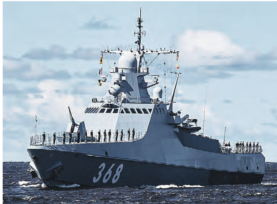
Патрульный корабль проекта 22160 «Василий Быков» на репетиции парада в честь Дня Военно-морского флота РФ в Кронштадте

Атака на наши мирные корабли обернется проблемами для Киева