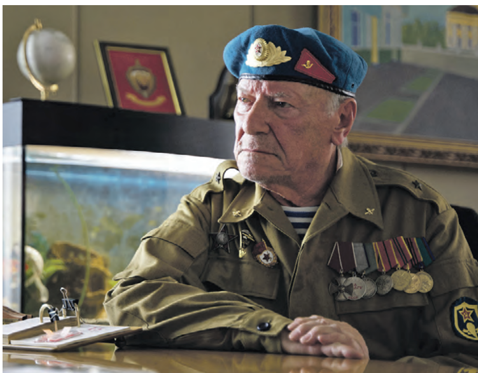
Василия Палыча, за которого готово вступить братство десантников, в киноленте «За Палыча!» сыграл народный артист РСФСР Сергей Шакуров

■ Кинотеатры показывают комедию «За Палыча!» Андрея Богатырева. Среди сценаристов — Алексей Чадов.